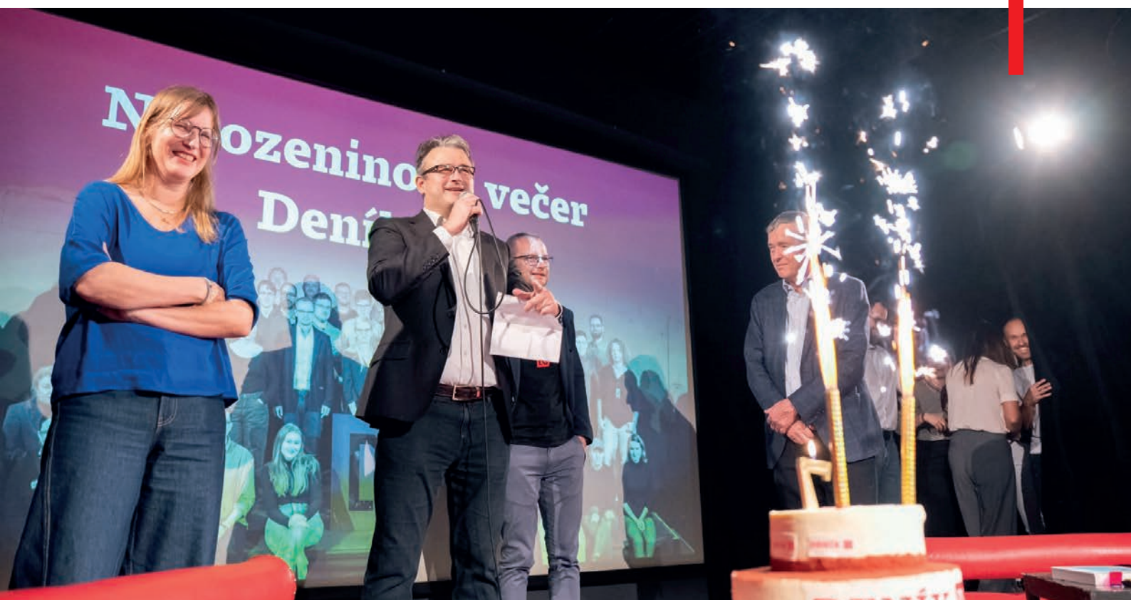
Narozeniny Deník N