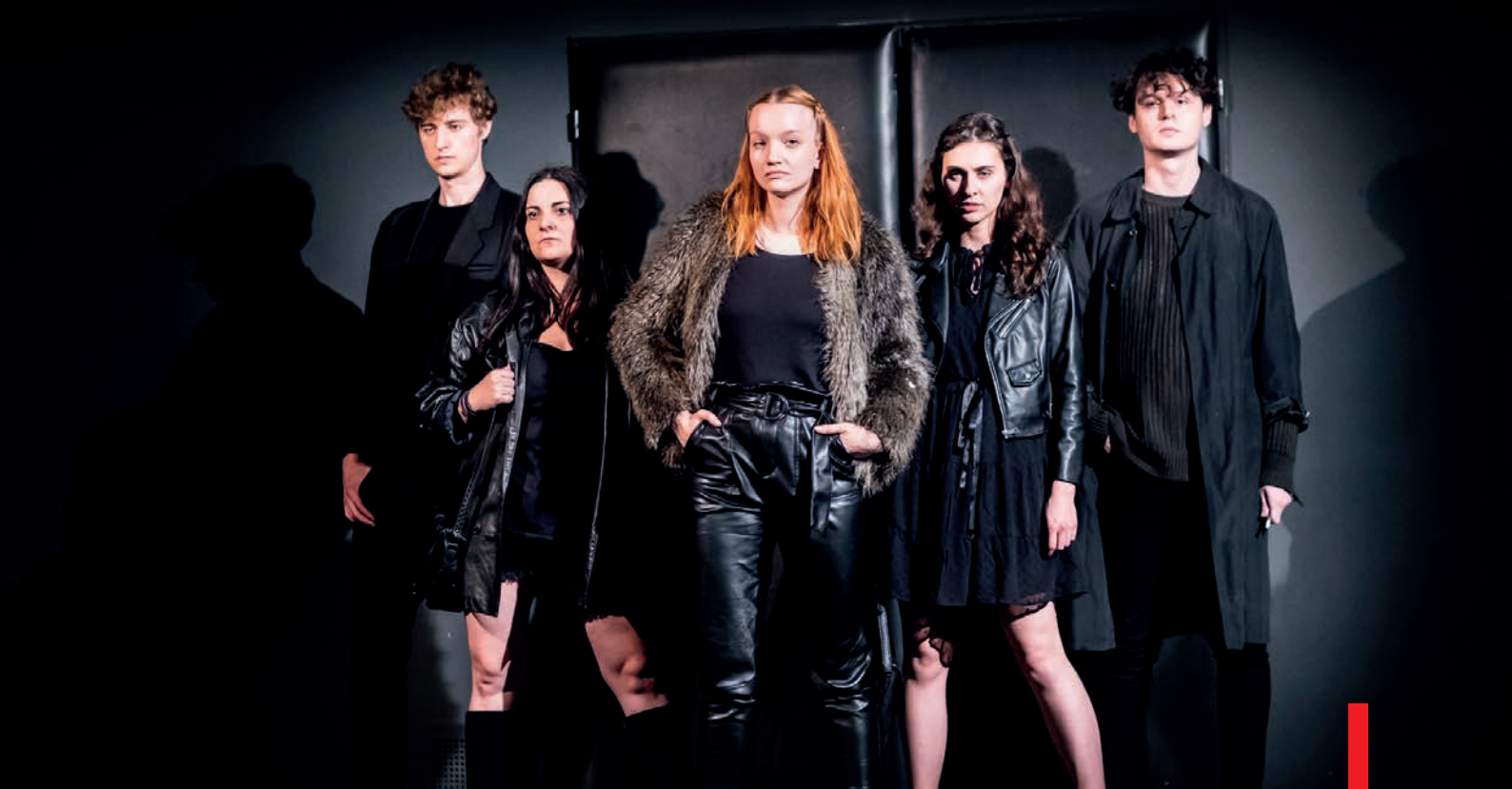
Divadlo: My děti ze stanice ZOO

dějiny v souvislostech současného dění. Tradičně vyprodáno bylo také při představení podcastu HistoRIP .