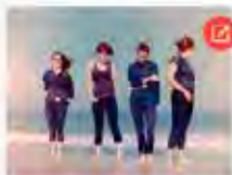
Savages. Dívčí kvarteto

Kromě své hudby zaujaly dívky ze Savages i svými manifesty, v nichž vysvětlují, že lidé by měli začít brát vážně umění, a také, že nesou čas přemýšlet o tom, jaký vliv na naši psychiku má internet a nekonečný proud informací, které nám tlačí do hlavy.