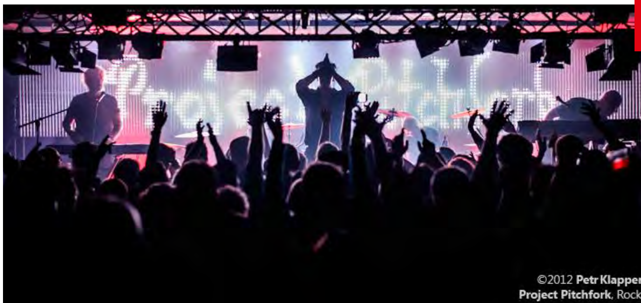
Foto: koncert Project Pitchforks

Zajímavou směsici namíchal náš produkční tým i na měsíc březen. Vše odstartovala domácí kapela Klika, jenž se k regulárním koncertním termínům dostala přes naše projekty vyhledávající zajímavé umělce, tedy Rock Café Contest a Free Zone. Aby paradoxně o den později na témže pódiu zahráli mega star z Německa, kapela Project Pitchfork. Byli jsme velmi potěšeni, když se Project Pitchfork po dvou letech vrátili na stejné místo a stejně jako tenkrát doslova uhranuli nabitě Rock Café. Kapela v mezidobí vydala skvělé nové album „Black“ a absolvovala hojně navštívené americké turné, aby se znovu vrátila do Evropy. Aby byl večírek ještě zajímavější, okořenilo večer vystoupení projektu Architect, za kterým se