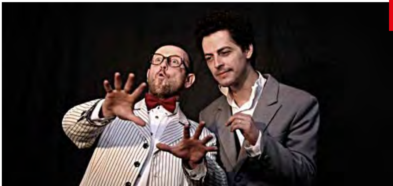
Foto: hra Jak se dělá divadlo