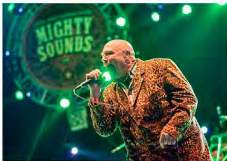
Bad Manners byli nejpopulárnějšími hvězdami prvního dne festivalu Mighty Sounds 2013

Jedna z hvězd loňského festivalu Mighty Sounds vystoupí ve čtvrtek 23. ledna v pražském klubu Rock Café. Britští Bad Manners přijdou připomenout éru ska osmdesátých let, pro které se vžilo označení 2 tone.