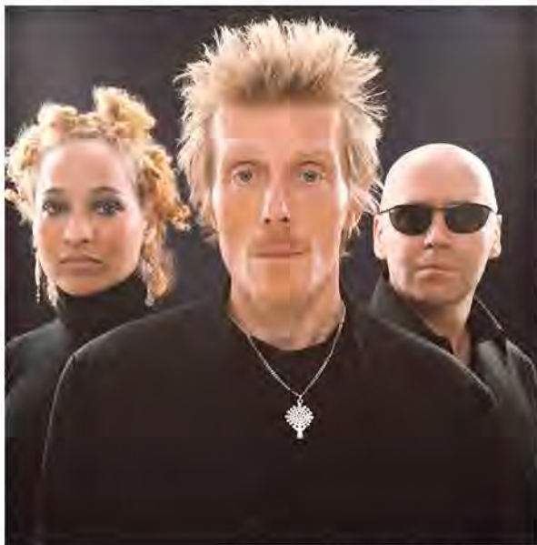
BRITSKÁ KÁPELA STEREO MC'S

PRAHA V pražském klubu Rock Café dnes vystoupí slavná britská kapela Stereo MC's. Kapela z Nottinghamu v rámci Full Connected Live Show + Collected Box Set Release Tour poprvé za dobu své existence přehraje kompletní album Connected. Zároveň nabídne skladby z nového CD boxu Collected, který obsahuje všechna jejich vydaná alba, nové skladby, remixy a doposud nevydané skladby z předešlých dob.