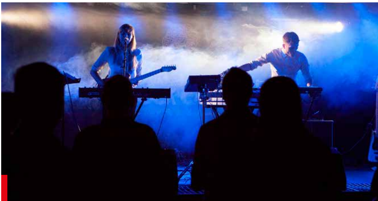
Foto: koncert Rebeka

skvělou deskou Mandrake, ze které byl velice cítit vliv jejich hudebních vzorů jako jsou Bad Religion, Propagandhi, Good Riddance. Návštěvníky čekal prostě skvělý gig plný energie od kapely, která do ČR zase jen tak brzy nedorazí. Jejich vystoupení u nás podpořil r'n'r objev Gold'N'Drunkards.