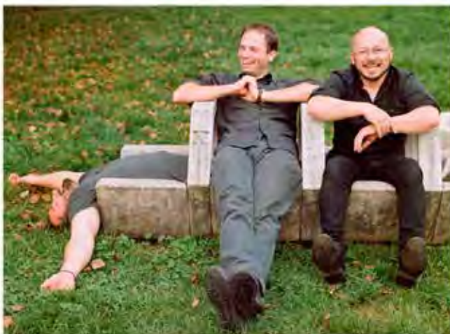
Korben Dallas

Skupina Korben Dallas už stačila doma na Slovensku posbírat tituly za nejlepší album, singl i živou kapelu. Teď se chystají na průlom v České republice s třetí deskou Banská Bystrica. iDNES.cz uvádí v premiéře první singl a klip Za sklom.