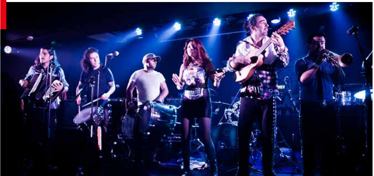
Foto: koncert Los De Abajo

Třídenní festival United Islands of Prague, respektive její klubová část a rovněž oficiální afterparty, měl opět po roce své zastavení i v našem klubu. V pátek