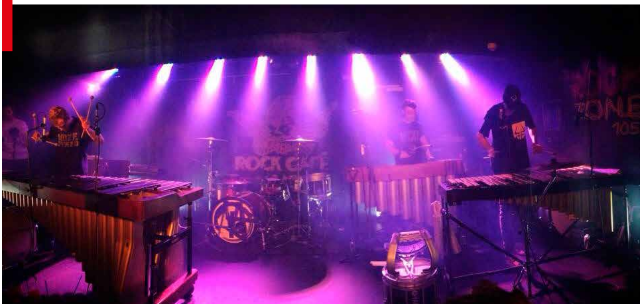
Projekt „Free Zone“, skupina Marimba Live Drums

Skrze jednotlivá Malá finále se do konečného klání propracovaly kapely Lex Barker, Volumen, What's Your Favorite Numer? A Citizen 37, respektive v loňském roce jsme jako pořadatel soutěže přistoupili k drobné změně a Velké finále rozšířili ještě o jednoho vystupujícího, který nás v průběhu celoročního klání nejvíce zaujal, a tomu udělil tzv. Divokou kartu, tentokrát padla štěstěna na kapelu Citizen 37.