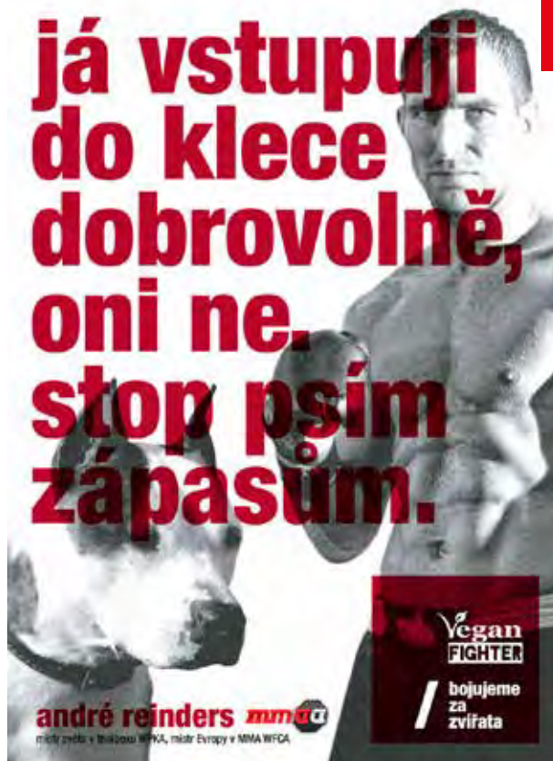
Foto: jeden z vystavujících vizuálů výstavy Vegan Fighter