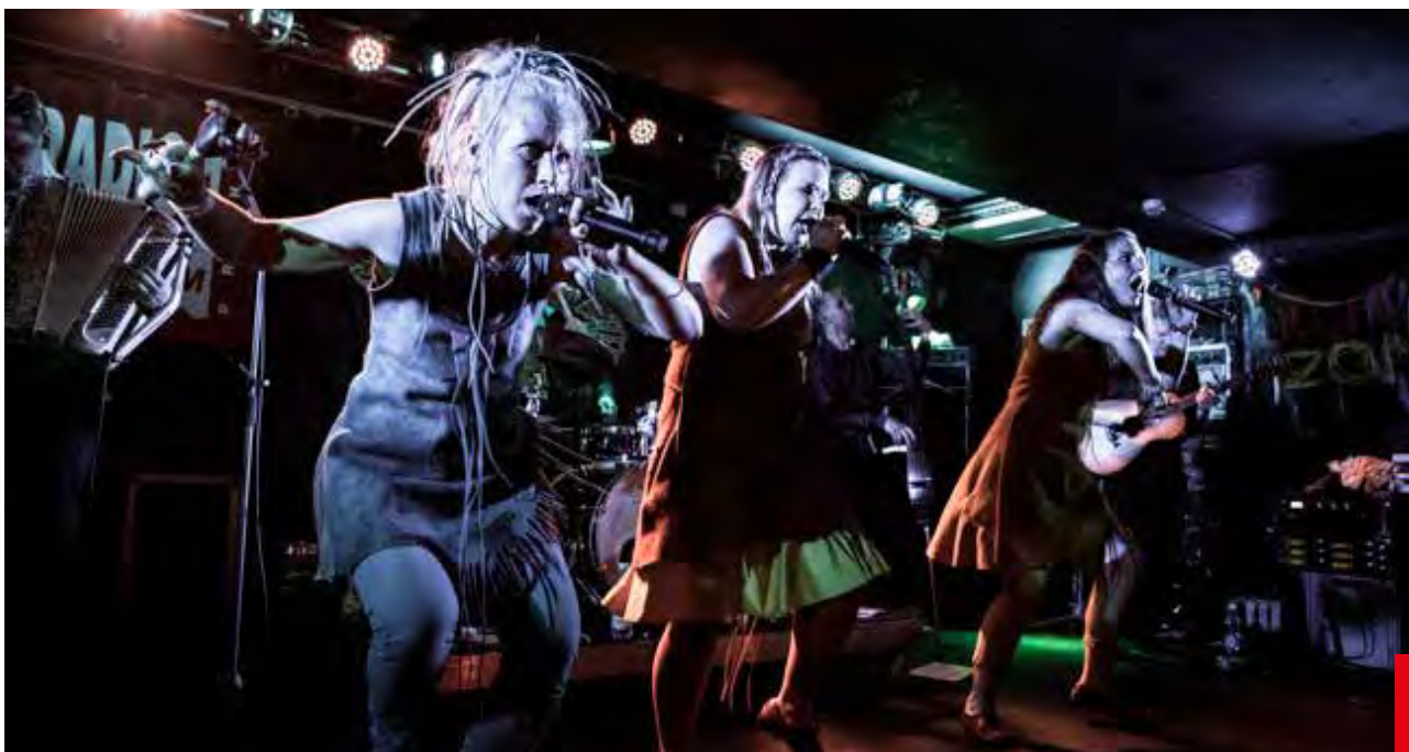
Foto: koncert Värttinä