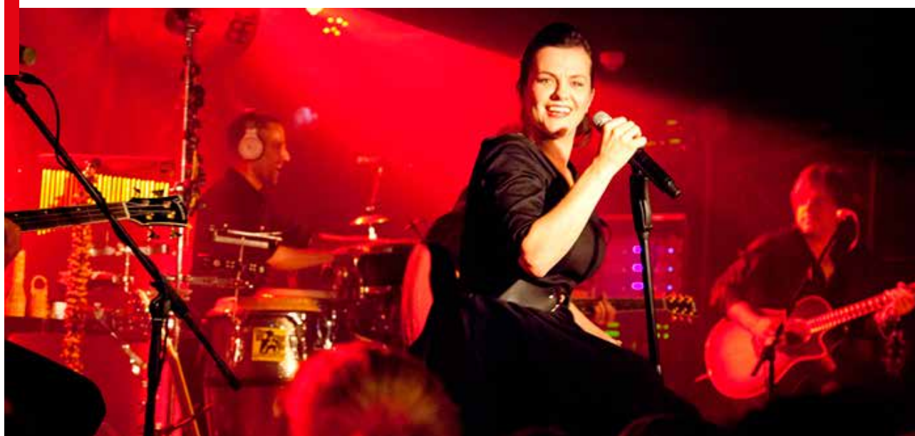
Foto: koncert Die Happy