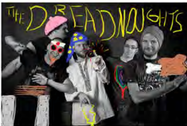
The Dreadnoughts

15.11.2014 | 17:14 | Přidat komentář | Sdílet