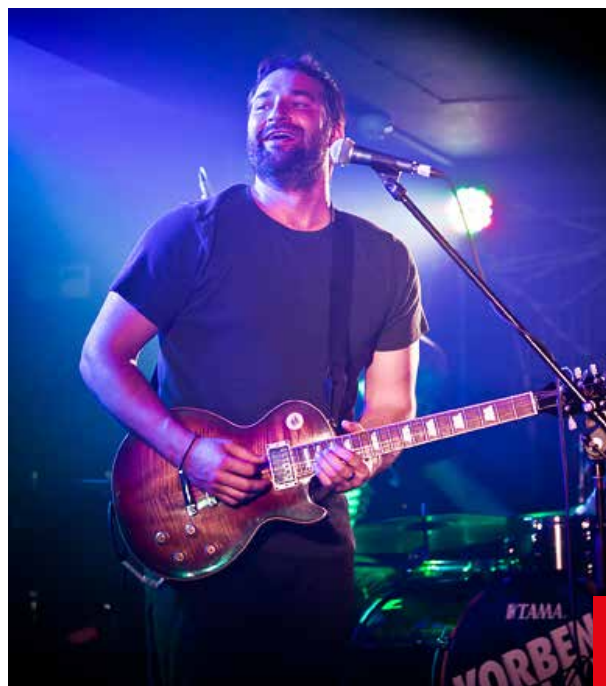
Foto: koncert Korben Dallas

(příloha číslo 7, rozhovor z kapelou, idnes)