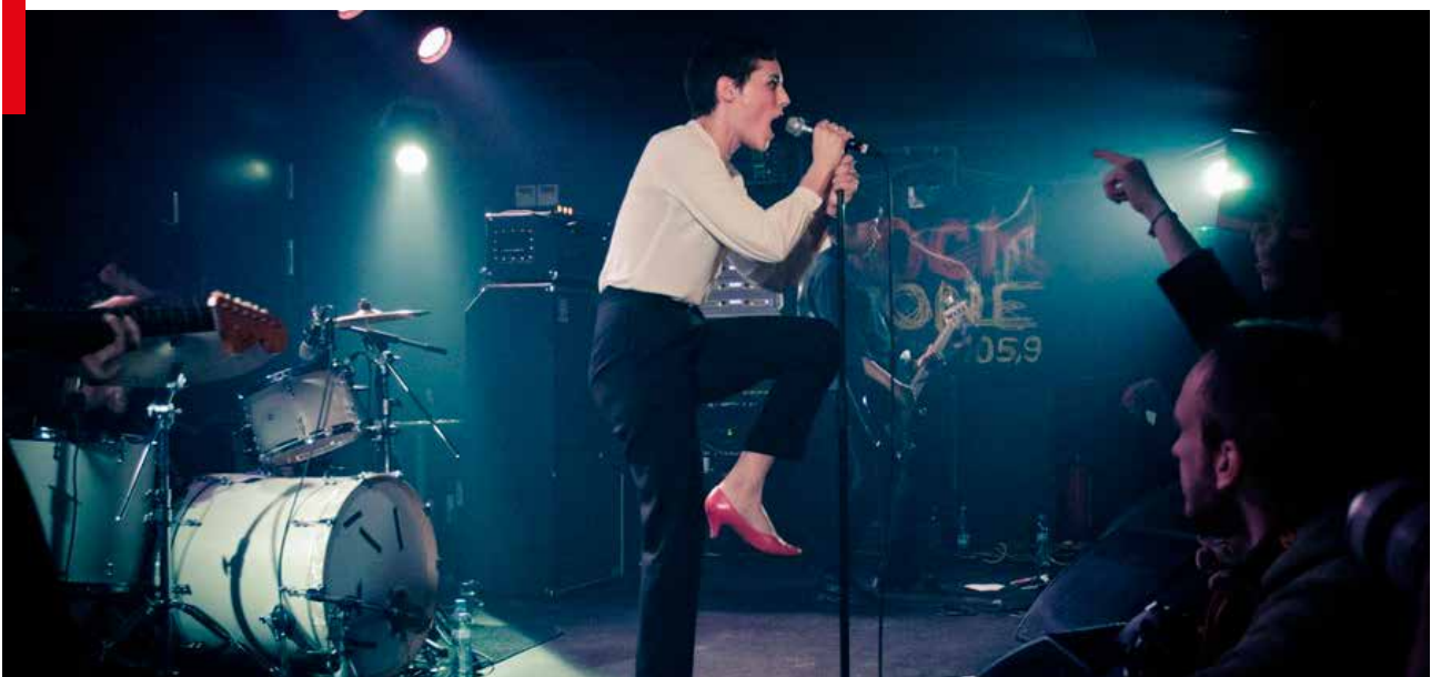
Foto: koncert Savages

„Party Hard Vol. II.“, to byla právě ta drsnější část měsíce, respektive rockově crossoverový koncertní večer v rámci oficiální výstavy k soutěži o nejlepší hudební design Megaton Fashion Show 2013.