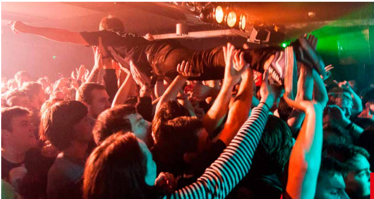
Foto: koncert The Dreadnoughts

Z jejich projevu pak sršela vnitřní síla, kterou žene tradiční bicí mašinérie tvořená dvěma bubeníky. Jako předskokany si přivezli rovněž americké Sierra a Jagged Vision.