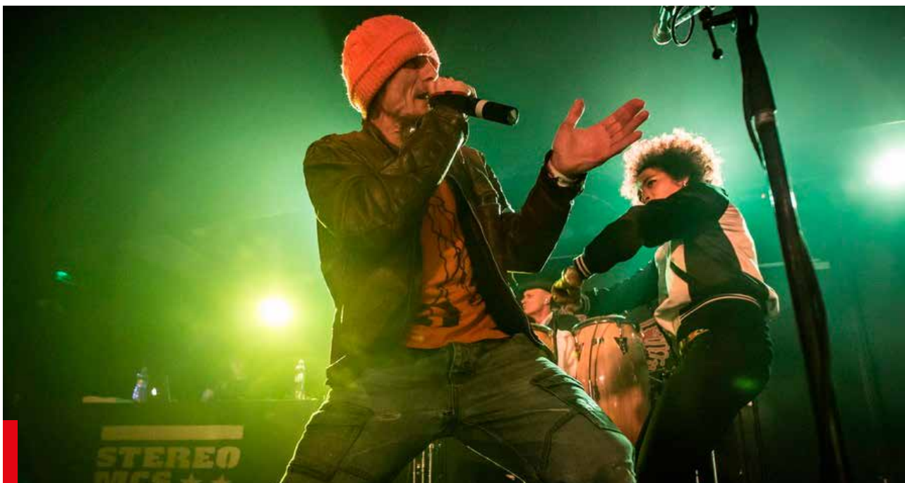
Foto: koncert Stereo MC's