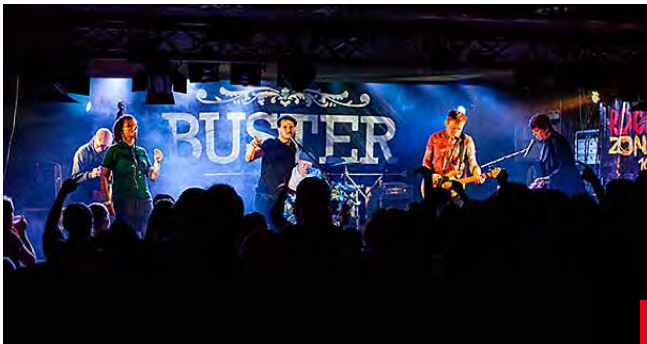
Foto: koncert Buster Shuffle

nové album, na kterém spolupracovali i s legendární kapelou Kosheen.