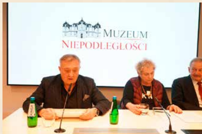
Mazowieckie Czytanie w siedzibie głównej Muzeum Niepodległości

Nawiązując do słów dyrektora Tadeusza Skoczka – „Czytajmy młodego Reymonta” – z okazji stulecia Nagrody Nobla dla pisarza, Muzeum Niepodległości zorganizowało akcję „Mazowieckie Czytanie utworów W. S. Reymonta”. Na inaugurację, która miała miejsce 13 listopada 2024 w Muzeum X Pawilonu Cytadeli Warszawskiej, oddziale Muzeum Niepodległości, zaprosiliśmy młodzież z warszawskich liceów ogólnokształcących.