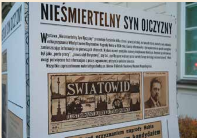
Wystawa plenerowa „Nieśmiertelny Syn Ojczyzny”

W imprezach zorganizowanych z okazji stulecia przyznania literackiej Nagrody Nobla polskiemu pisarzowi uczestniczyli seniorzy z terenów dotkniętych powodzią na Dolnym Śląsku. Przybyła