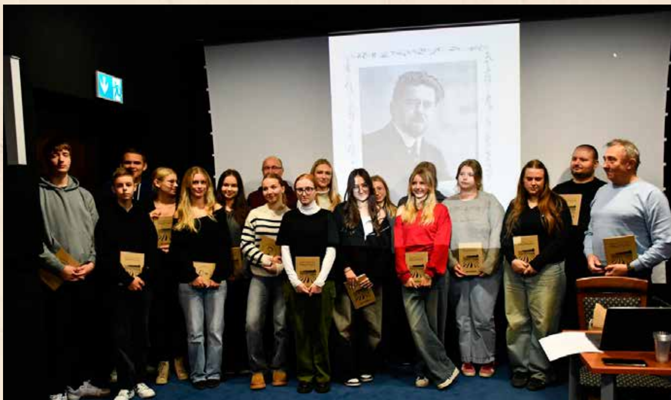
Młodzież uczestnicząca w inauguracji Mazowieckiego Czytania utworów W. S. Reymonta otrzymała najnowszą publikację Na zagonie

wojny światowej. Autor z charakterystyczną dla siebie precyzją opisuje losy zwykłych ludzi, uwikłanych w wielkie wydarzenia historyczne.