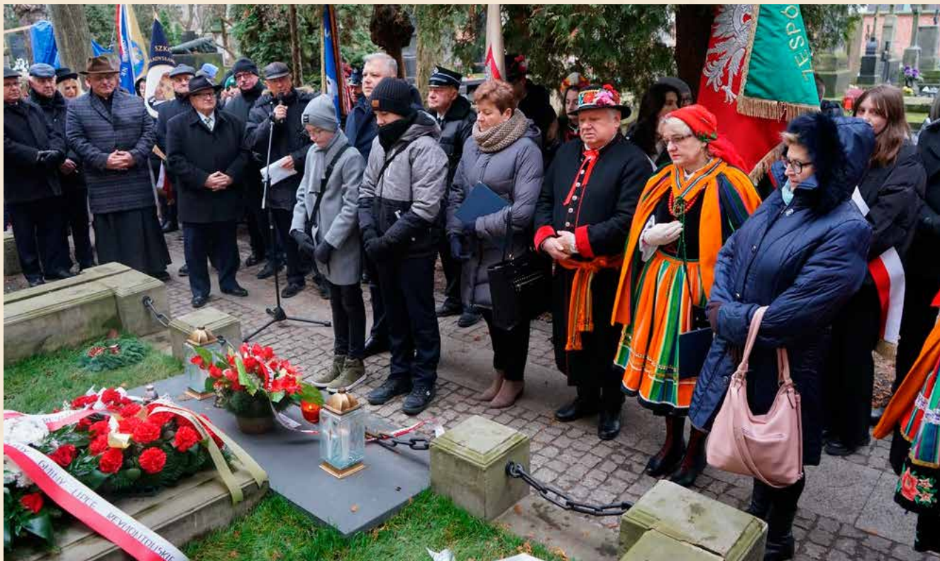
Uroczystości przy grobie Reymonta z okazji rocznicy śmierci pisarza

dent RP Bronisław Komorowski. Ekspozycja prezentowana była następnie w Opinogórze, Płocku, Legnicy, Jeleniej Górze. Towarzyszył jej katalog o tym samym tytule.