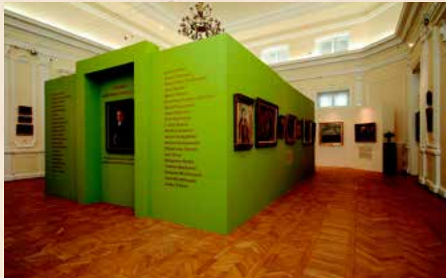
Fragment ekspozycji poświęconej Reymontowi, prezentowanej w Muzeum Niepodległości włączyć się do obchodów jubileuszowych.

– Przypominanie i upamiętnienie w wielu imprezach to nasz ludowy, patriotyczny obowiązek. Obchody winny odbywać się w całej Polsce, a także poza jej granicami. Muzea i instytucje kultury w całym kraju – a szczególnie na Mazowszu, z którego się wywodził wielki pisarz – powinny