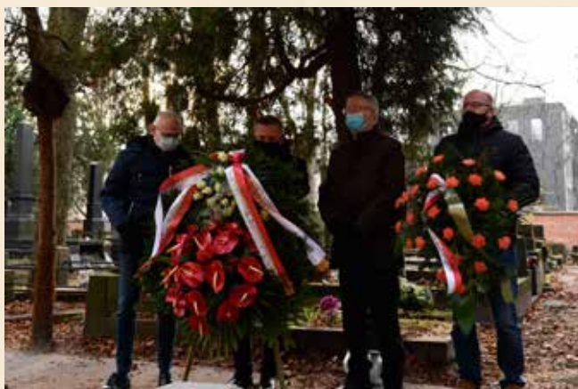
W realizacji rocznicowych upamiętnień nie przeszkodziła nawet pandemia

Ilustracja na stronie tytułowej: Jerzy Mech, Portret Władysława Reymonta , Warszawa, 1994, olej na płótnie, ze zbiorów MHPRL