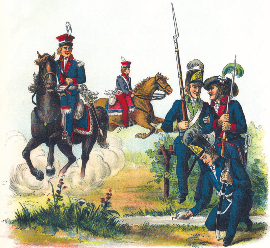
1. M. Stachowicz rysował z natury.