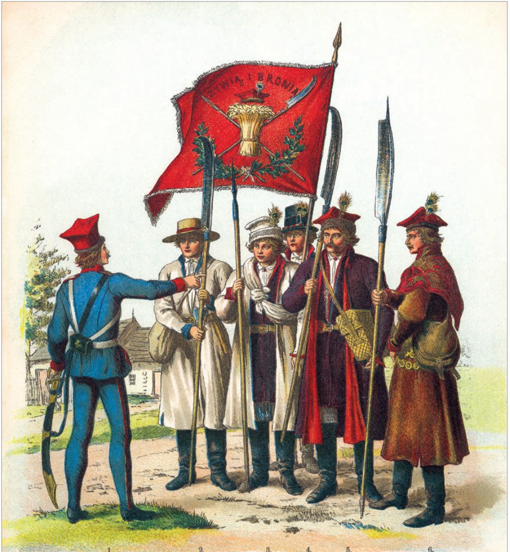
1. Walery Eljasz rysował