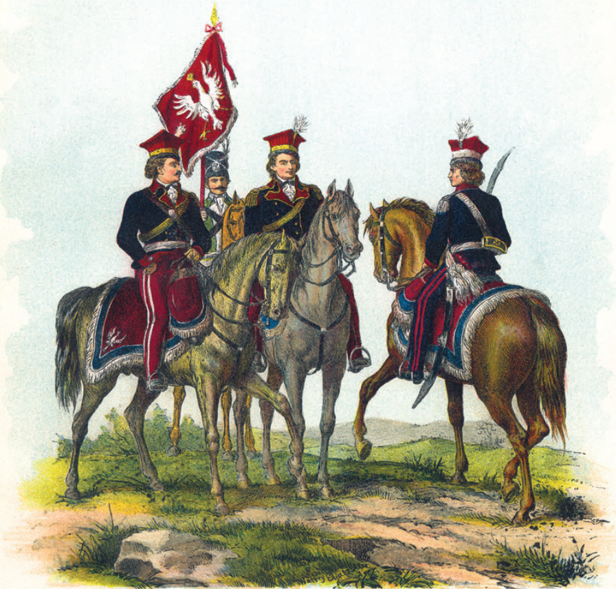
1. Walery Eljasz rysował. 2. Naśladownictwo zastrzeżone. 3. Nakład Księgarni Katolickiej w Poznaniu. 4.