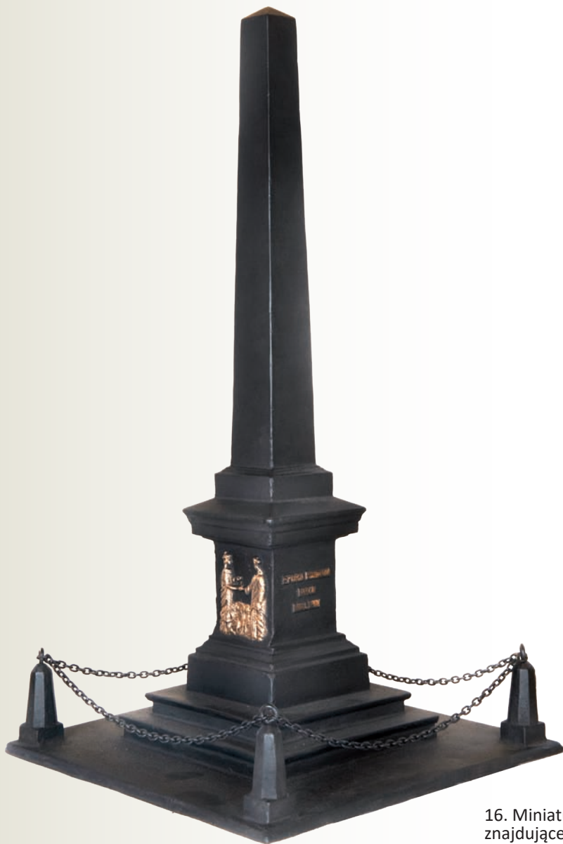
16. Miniaturowa kopia pomnika Unii Lubelskiej z XIX wieku, znajdującego się na Placu Litewskim w Lublinie