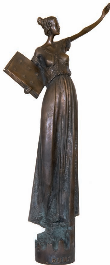
19. Wiesław Domański, Sybilla Roma , rzeźba