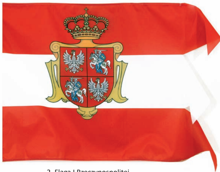
2. Flaga I Rzeczypospolitej