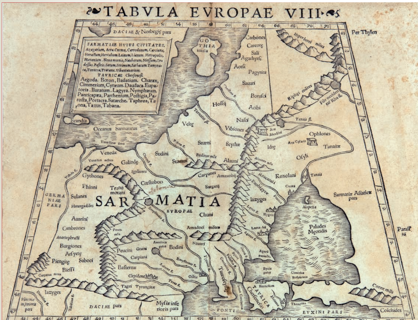
4. Tabula Europae – mapa Europy z XVI wieku, drzeworyt pochodzący z Kroniki świata wydanej w Norymberdze w 1493 roku, wykonany w pracowni drzeworytniczej Michaela Wolgemuta