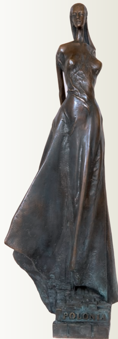
24. Wiesław Domański, Sybilla Polonia , rzeźba