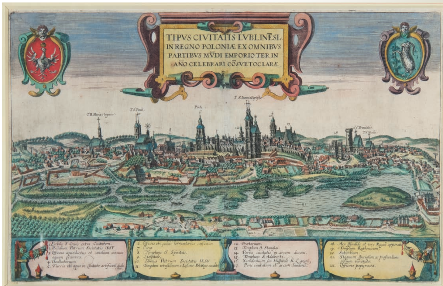
13. Widok Lublina z początku XVI wieku