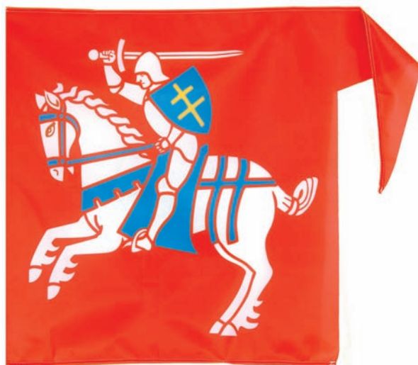
3. Flaga Litwy