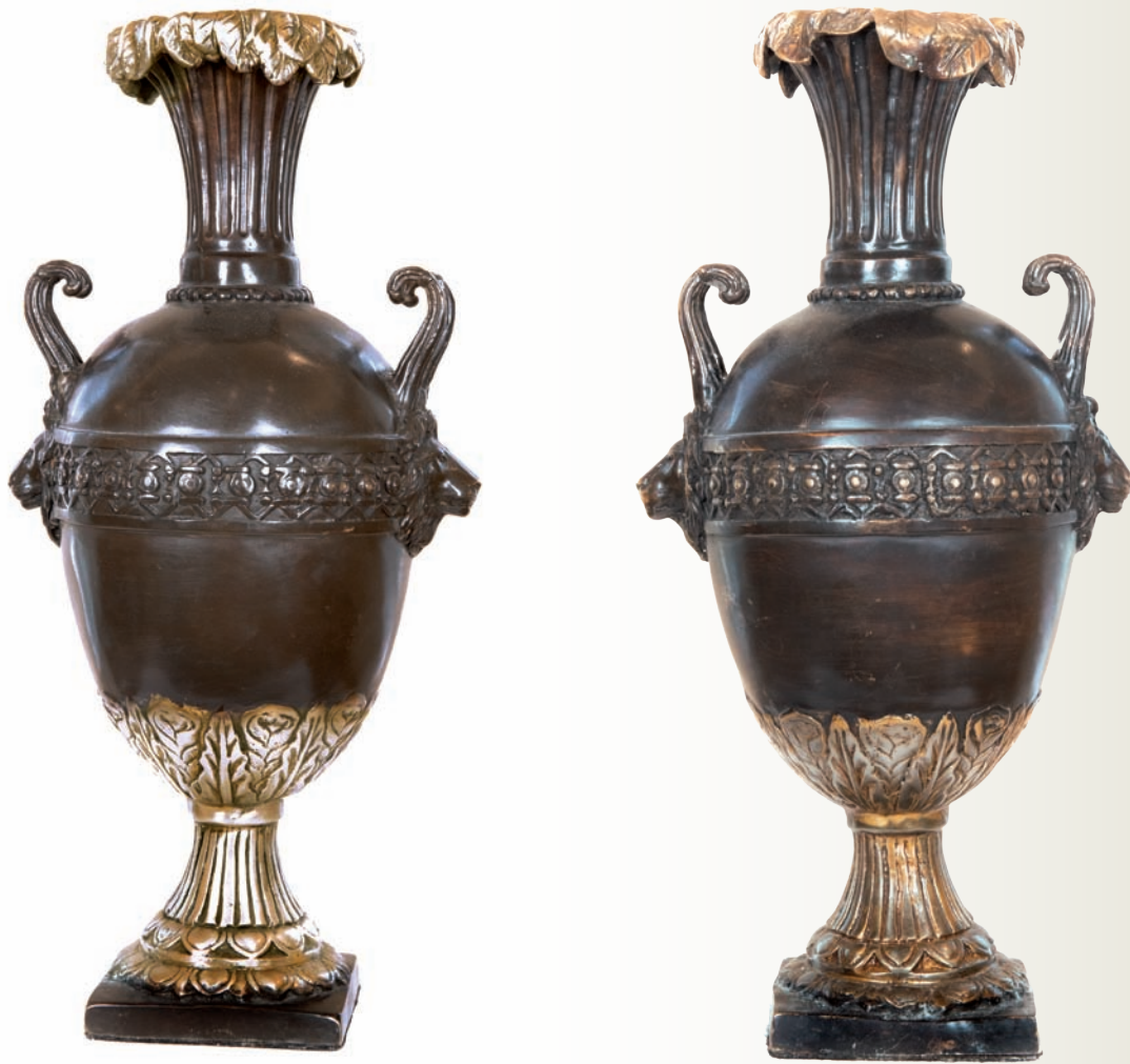
8-9. Dwie wazy z brązu