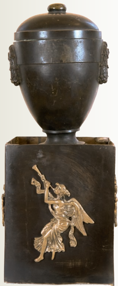
7. Omfalos z brązu (urna z sentencją unus...mundus )