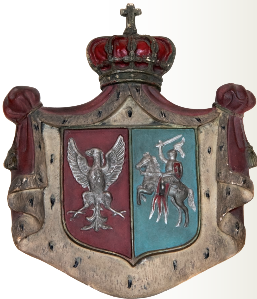
17. Kartusz z herbem I Rzeczypospolitej Obojga Narodów