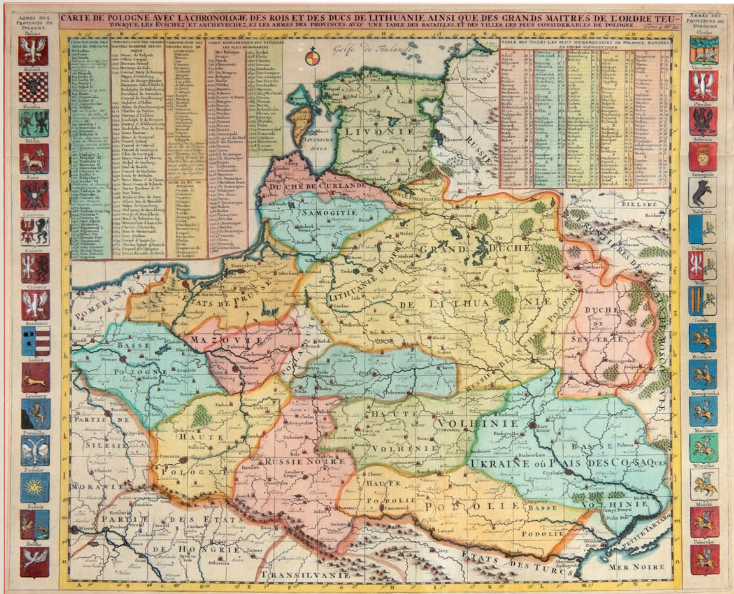
1. Mapa ziem I Rzeczypospolitej