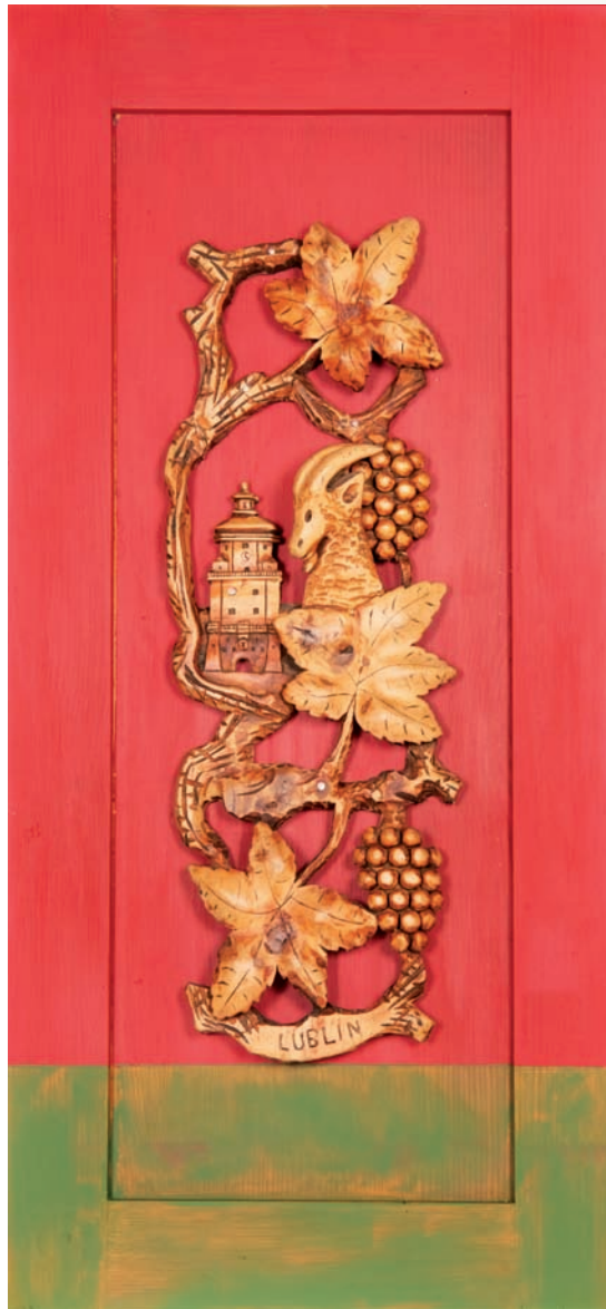
15. Stylizowany herb Lublina z XX wieku