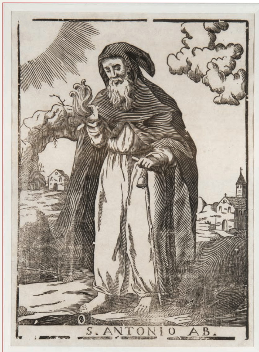
12. S. Antonio Ab. (św. Antoni – patron Lublina), grafika z XVII wieku