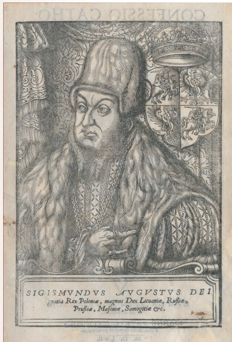
14. Sigismundus Augustus Portret króla Zygmunta Augusta, miedzioryt z II połowy XVI wieku