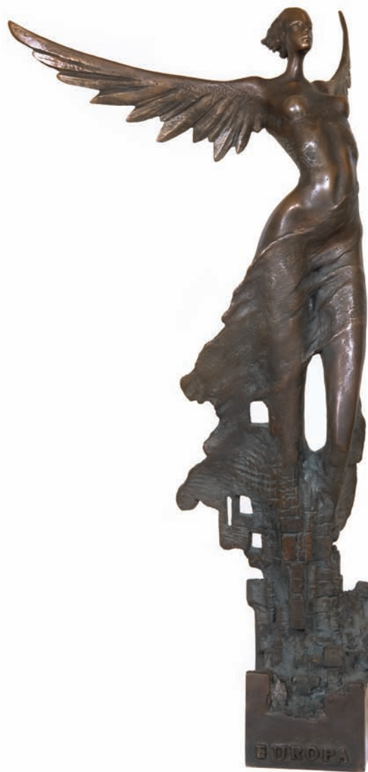
22. Wiesław Domański, Sybilla Europa , rzeźba