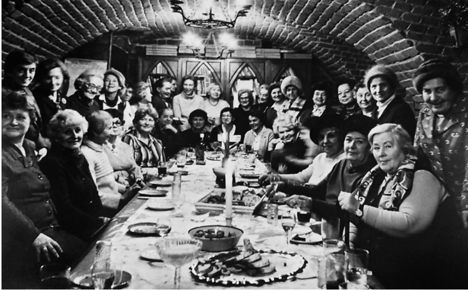
Koło Wychowanek Gimnazjum im. Leonii Rudzkiej podczas spotkania opłatkowego w siedzibie Oddziału Stare Miasto TPW, 1985 rok