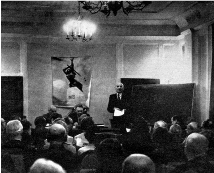
II Walne Zgromadzenie Delegatów TPW, 13 marca 1967 roku