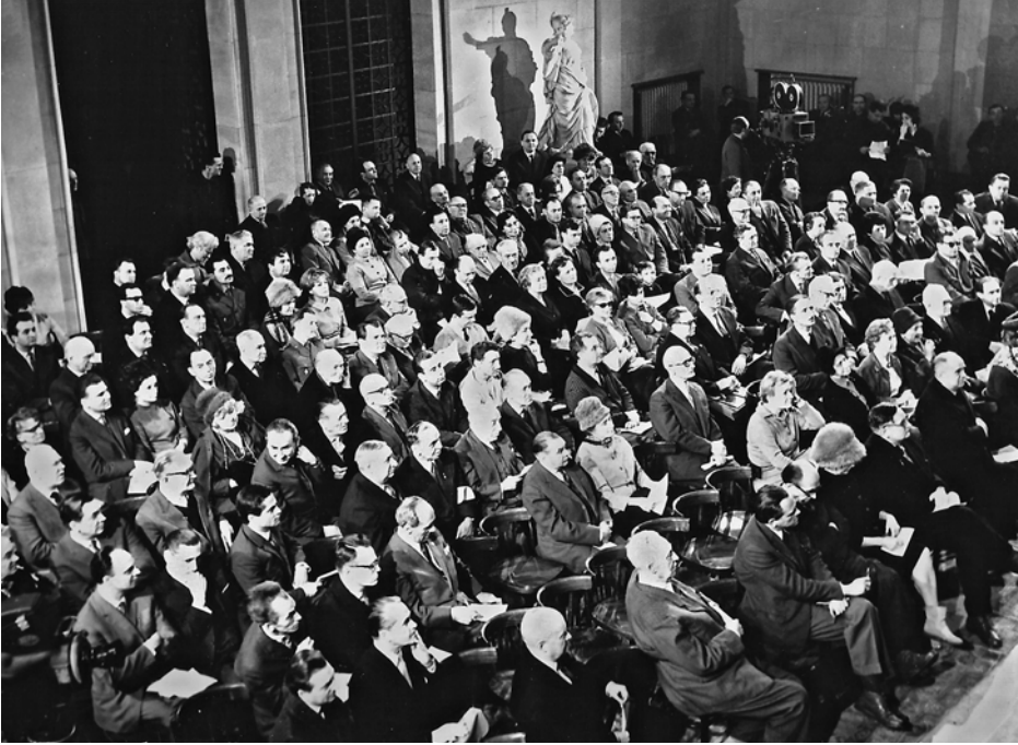
Hol główny w Muzeum Narodowym w Warszawie. Walne Zebranie Członków Towarzystwa Przyjaciół Warszawy, 24 lutego 1964 roku