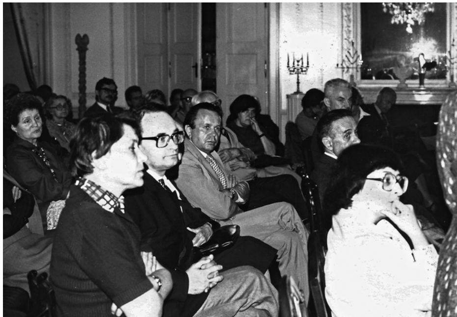
XV Doroczne Spotkania Varsavianistów, Nieborów, 16 czerwca 1980 roku