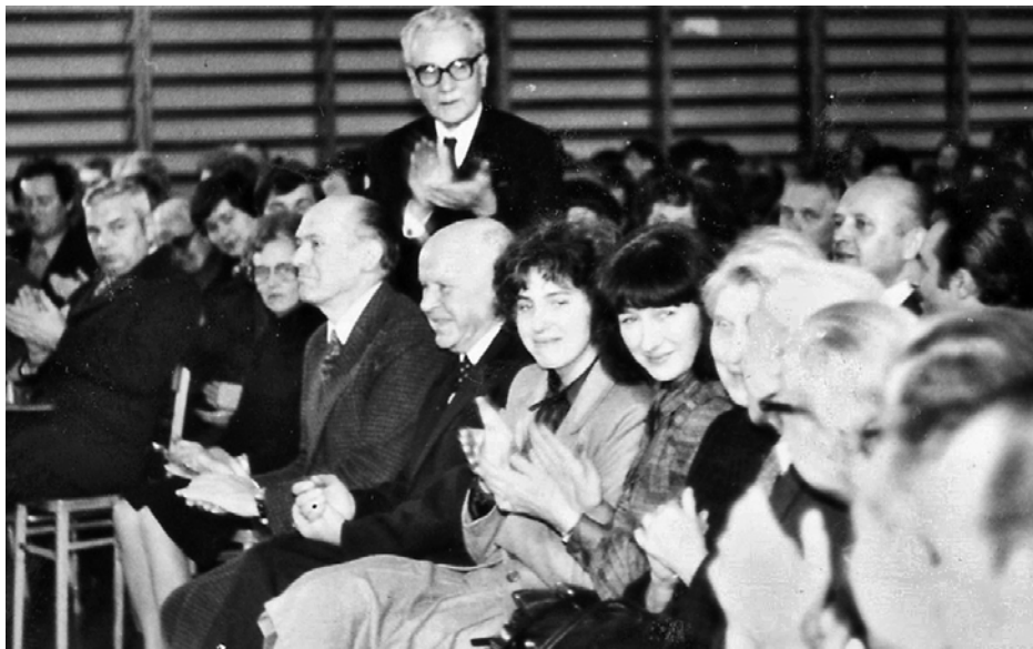
Nadanie imienia prof. Stanisława Herbsta Liceum Ekonomicznemu nr 9 przy ul. Otwockiej 3 w Warszawie, 10 listopada 1979 roku