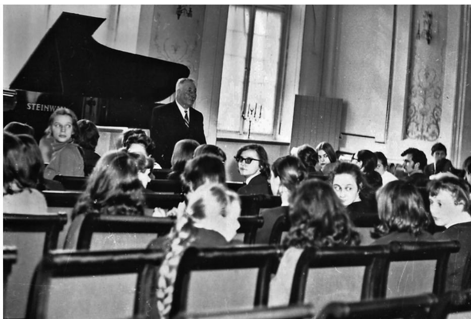
Podsumowanie Kursów wiedzy o Warszawie, Pałac Ostrogskich, 27 marca 1971 roku