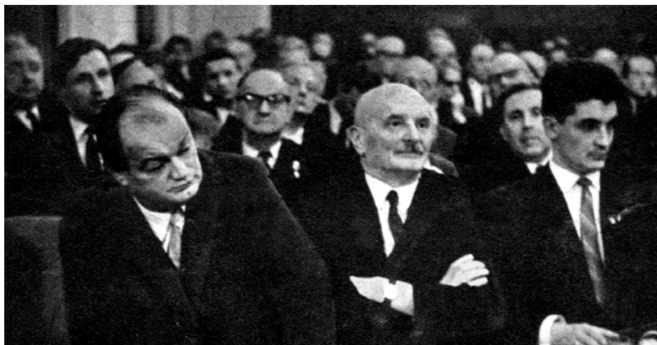
II Walne Zgromadzenie Delegatów TPW, 13 marca 1967 roku