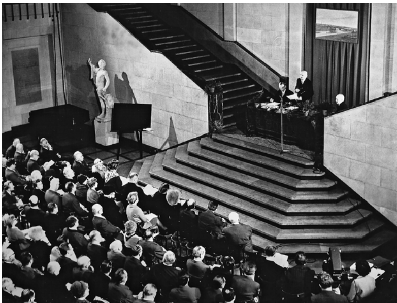
Walne Zebranie Członków Towarzystwa Przyjaciół Warszawy w Muzeum Narodowym w Warszawie, 24 lutego 1964 roku