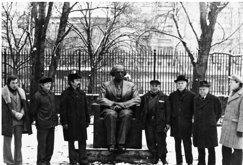
Pomnik Ignacego Paderewskiego odnaleziony przez członków TPW, ustawiony na wewnętrznym dziedzińcu Muzeum Narodowego