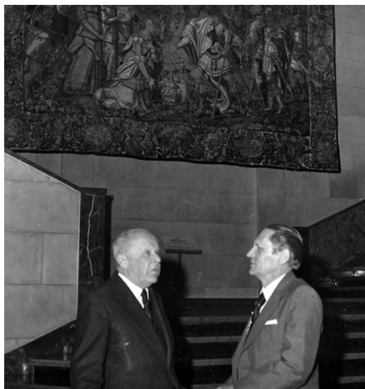
Uroczyste przekazanie arrasów Dawid i Abigail przez Towarzystwo Przyjaciół Warszawy na rzecz Zamku Królewskiego w Warszawie, 10 czerwca 1976 roku