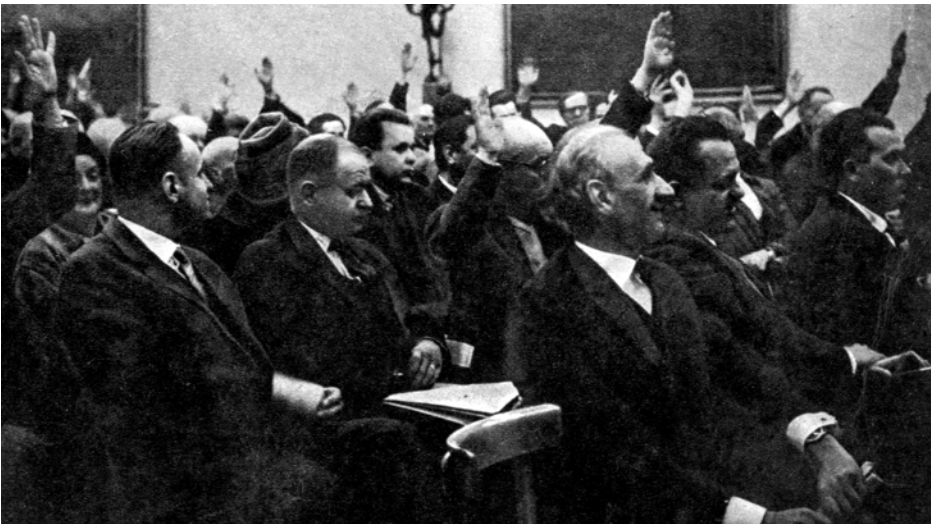
Zebranie organizacyjne Towarzystwa Przyjaciół Warszawy, Muzeum Narodowe w Warszawie, 18 marca 1963 roku