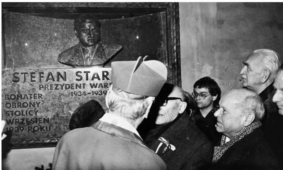
Bazylika Archikatedralna św. Jana w Warszawie. Uroczysta msza św. i poświęcenie tablicy-pomnika pamięci Stefana Starzyńskiego, 1 marca 1981 roku