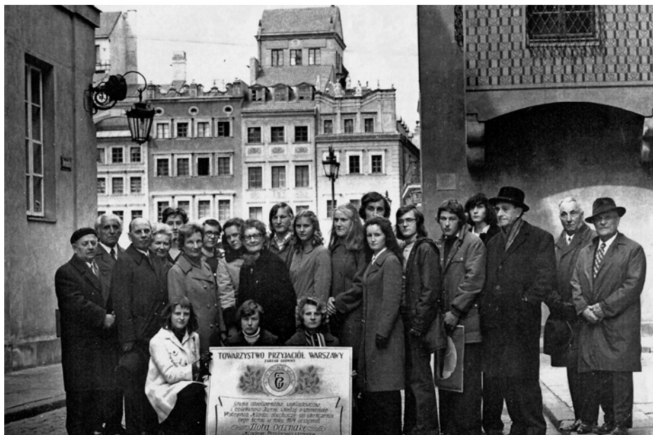
Grupa absolwentów, wykładowców i opiekunów Kursu wiedzy o Warszawie na Starym Mieście, po ukończonym cyklu szkolenia w roku 1974