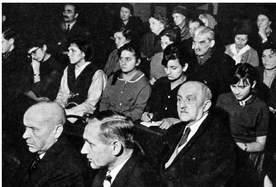
Członkowie-założyciele na zebraniu inauguracyjnym Oddziału Praga Północ TPW