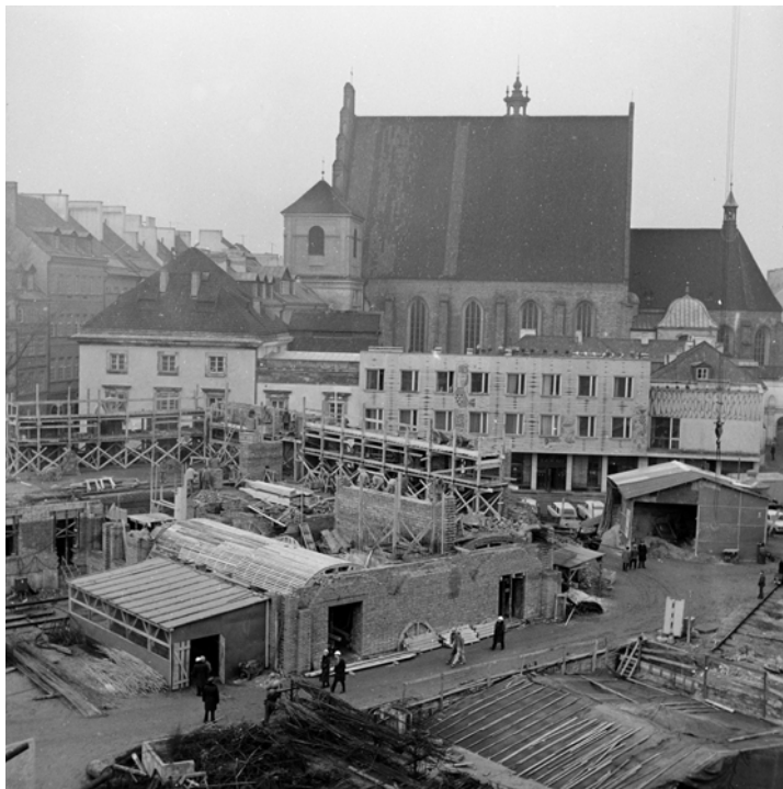
Widok z murów odbudowywanego Zamku w stronę katedry św. Jana, 1973 rok