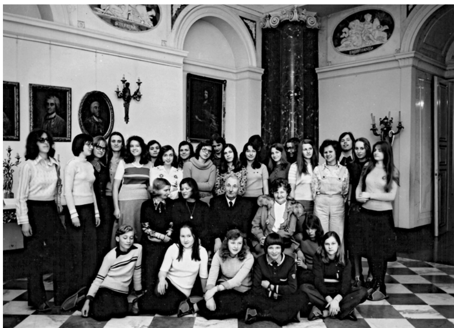
Grupa społecznych przewodników po Bibliotece Stanisławowskiej w Warszawie wyłoniona spośród słuchaczy Kursu wiedzy o Warszawie w roku szkolnym 1974/1975