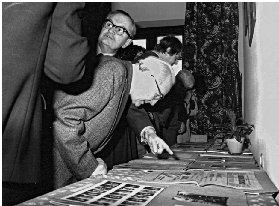
Muzeum Historyczne m.st. Warszawy, wystawa prezentująca „Zbiory Korotyńskich”, 11 marca 1982 roku