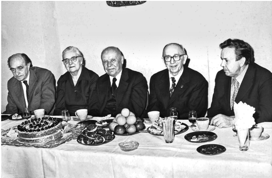
80-lecie urodzin prof. Stanisława Lorentza, uroczystość zorganizowana przez członków ZG TPW w Stołecznym Domu Kultury Nauczyciela na Starym Mieście, 27 kwietnia 1979 roku