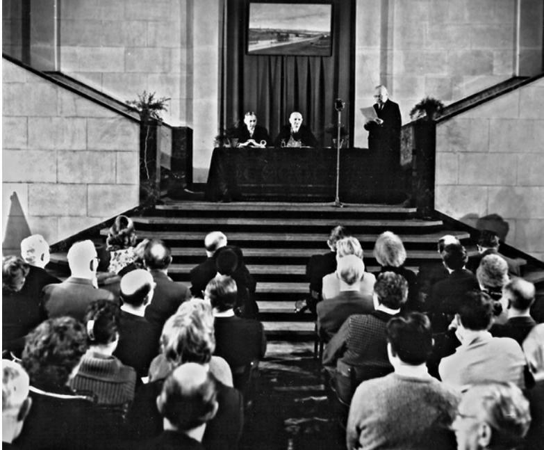
Walne Zebranie Członków Towarzystwa Przyjaciół Warszawy w Muzeum Narodowym w Warszawie, 24 lutego 1964 roku