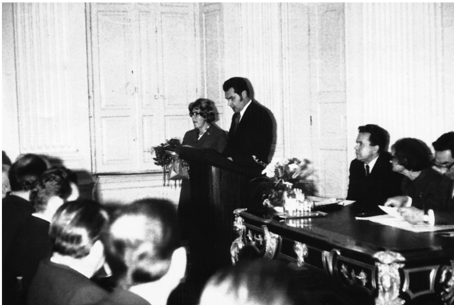
IV Walne Zgromadzenie Delegatów TPW, Pałac w Wilanowie, 18 listopada 1973 roku