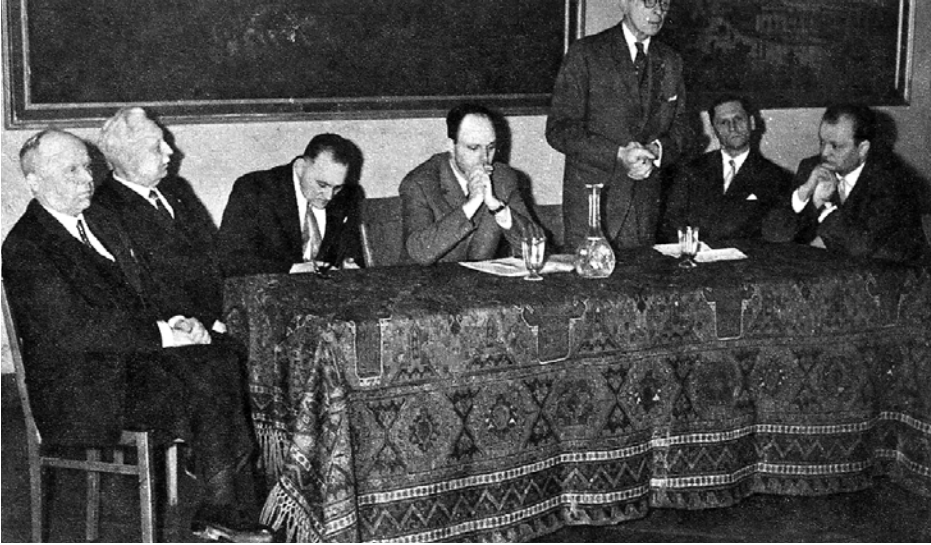
Prezydium zebrania organizacyjnego Towarzystwa Przyjaciół Warszawy, Muzeum Narodowe w Warszawie, 18 marca 1963 roku