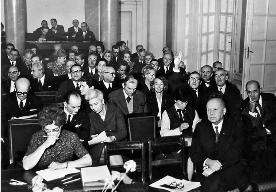
III Walne Zgromadzenie Delegatów TPW. Sala Lustrzana w Pałacu Staszica, 15 listopada 1970 roku