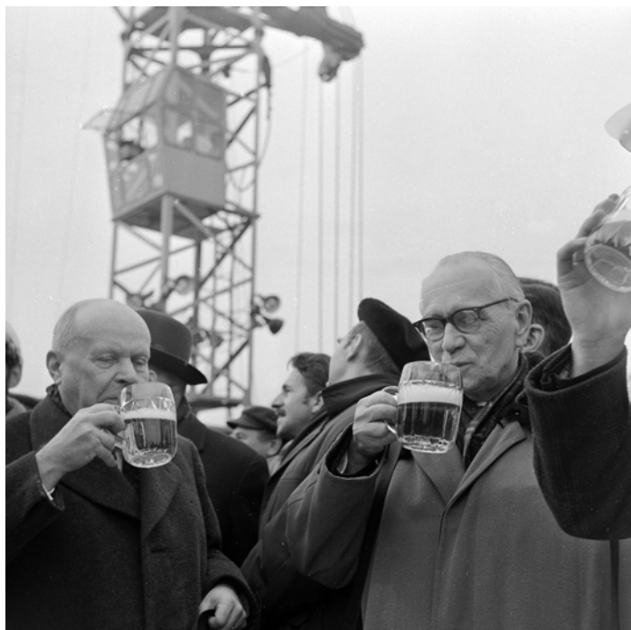
Wieszanie „wiechy” na odbudowanej części gotyckiej Zamku Królewskiego w Warszawie, 1973 rok