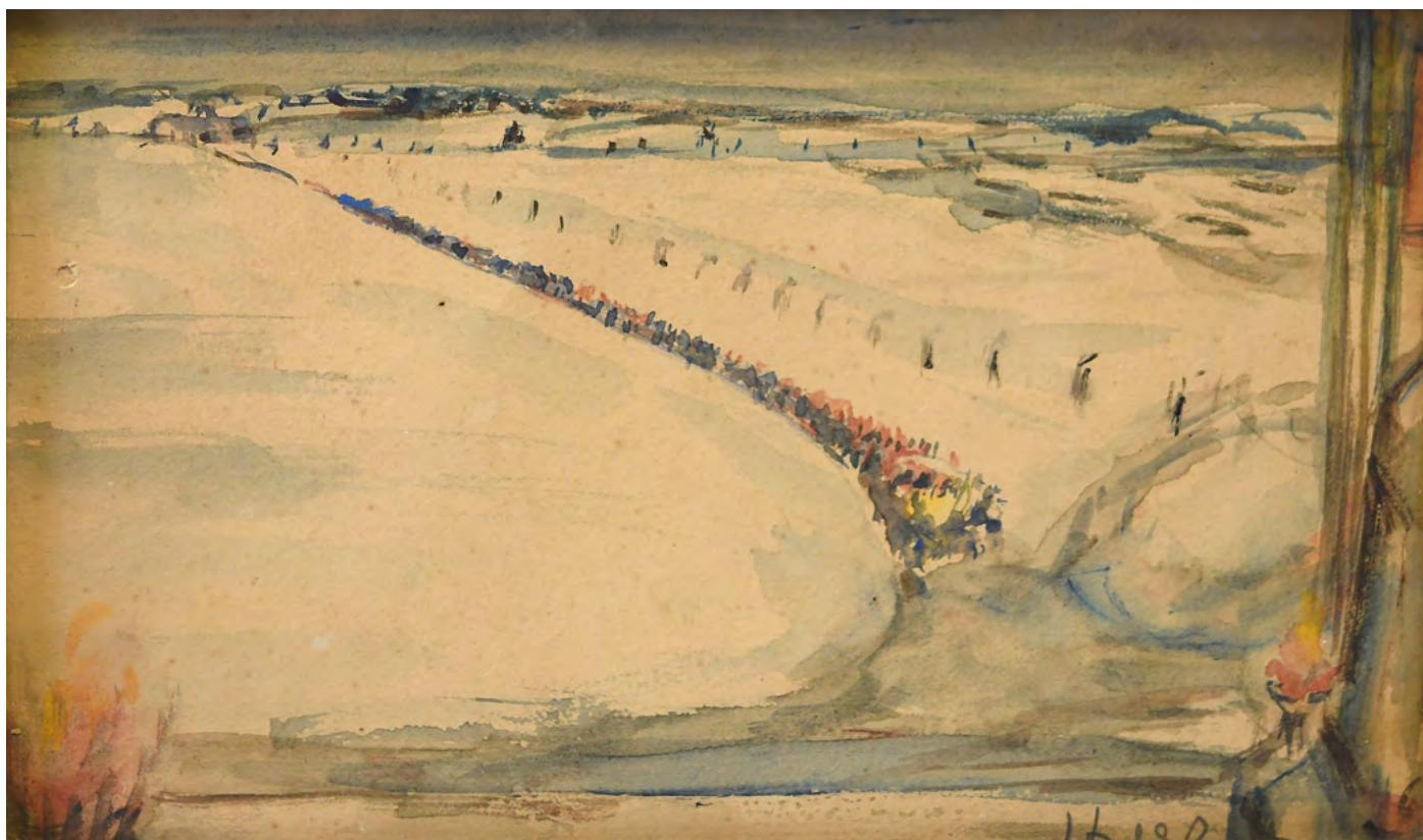
20 Więźniarka KL Auschwitz Marsz śmierci (01.1945)