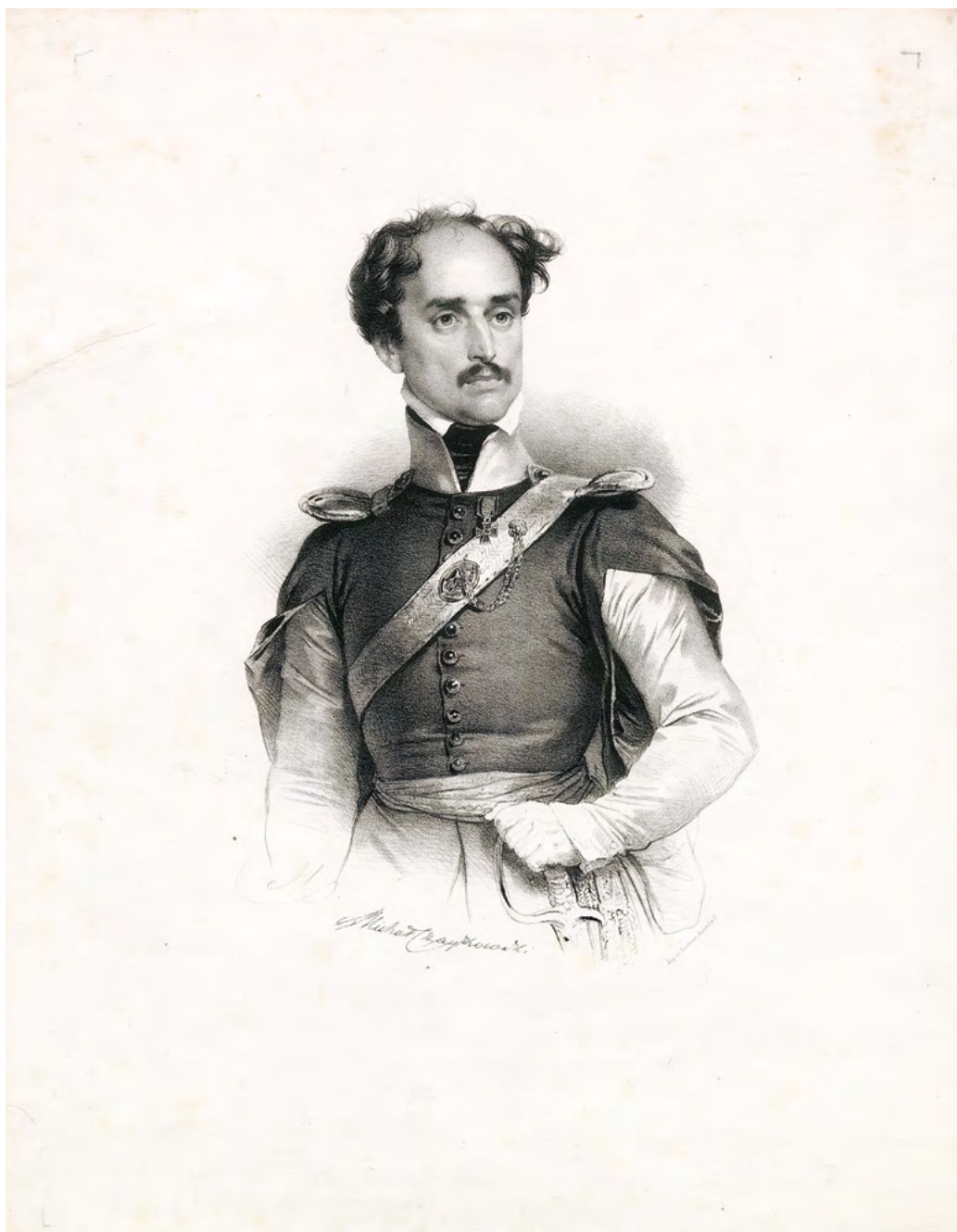
2 Bernard Lemercier Portret Michała Czajkowskiego (1830-1850)