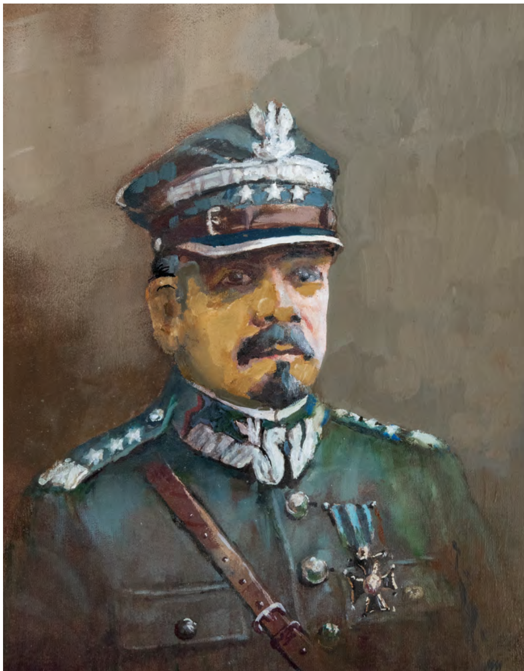
12 Maciej Milewski; Generał Józef Haller; (2020)