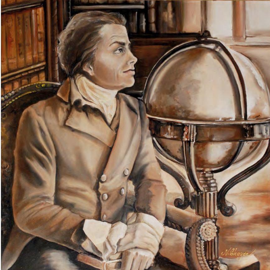
I Natalia Shayon Tadeusz Kościuszko przy globusie (Przed 2017)