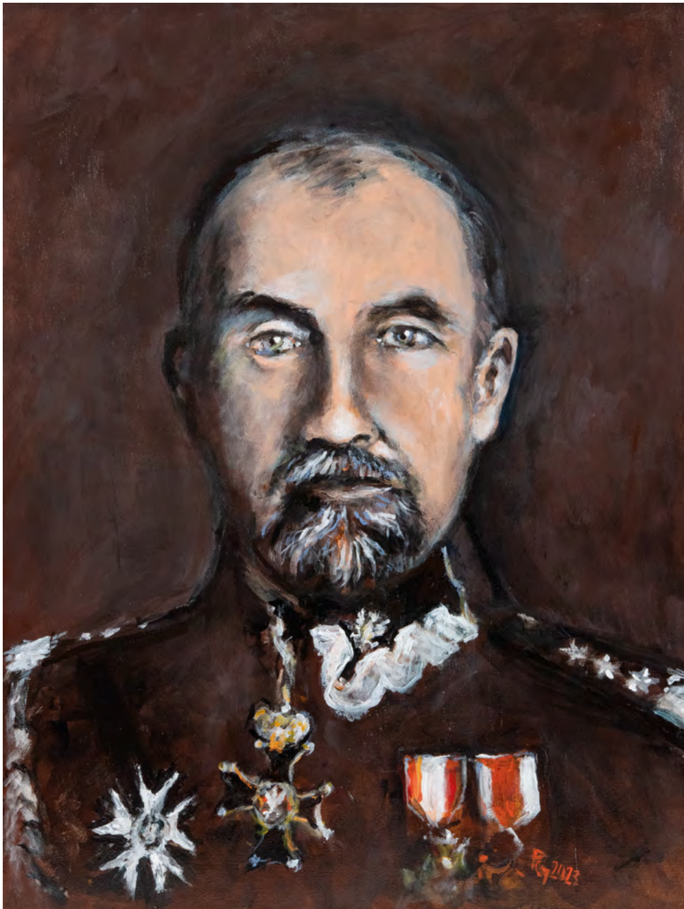
13 Piotr Gagan General Tadeusz Jordan Rozwadowski (2023)