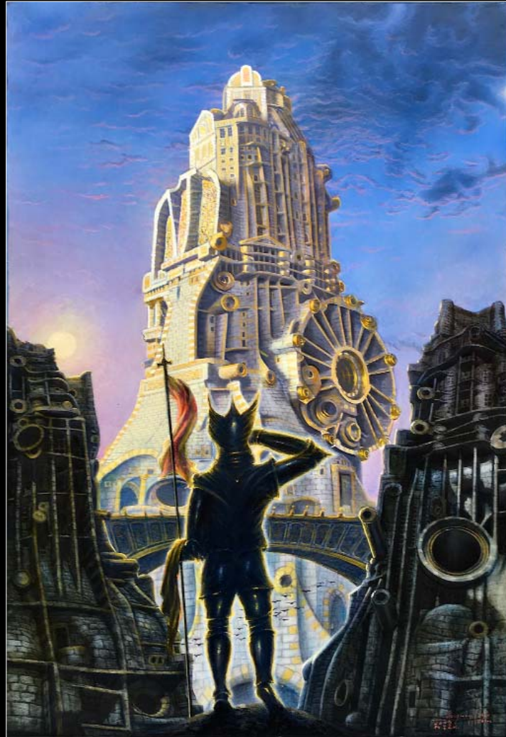
29. W dalekim kraju (Ryszard Wagner, Lohengrin ) / In einem fernen Land (Richard Wagner, Lohengrin ) 2019, 107 × 82, € 12 000,00