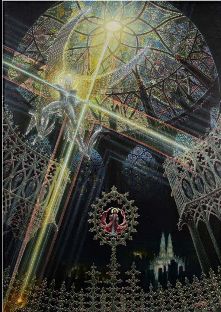
9. Moc krzyża / Die Kraft des Kreuzes 2008, 103 × 77, € 12 000,00