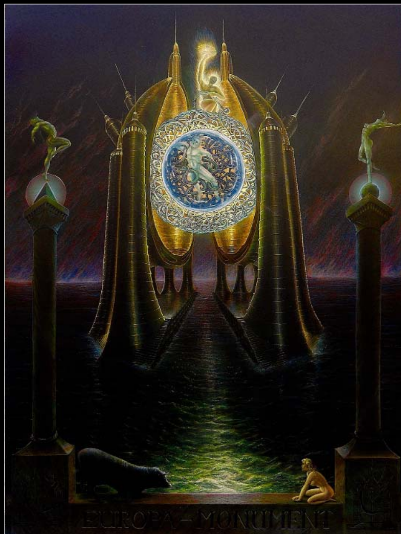
13. Pomnik Unii Europy / Monument Union Europa 2016, 99 × 79, €12 000,00