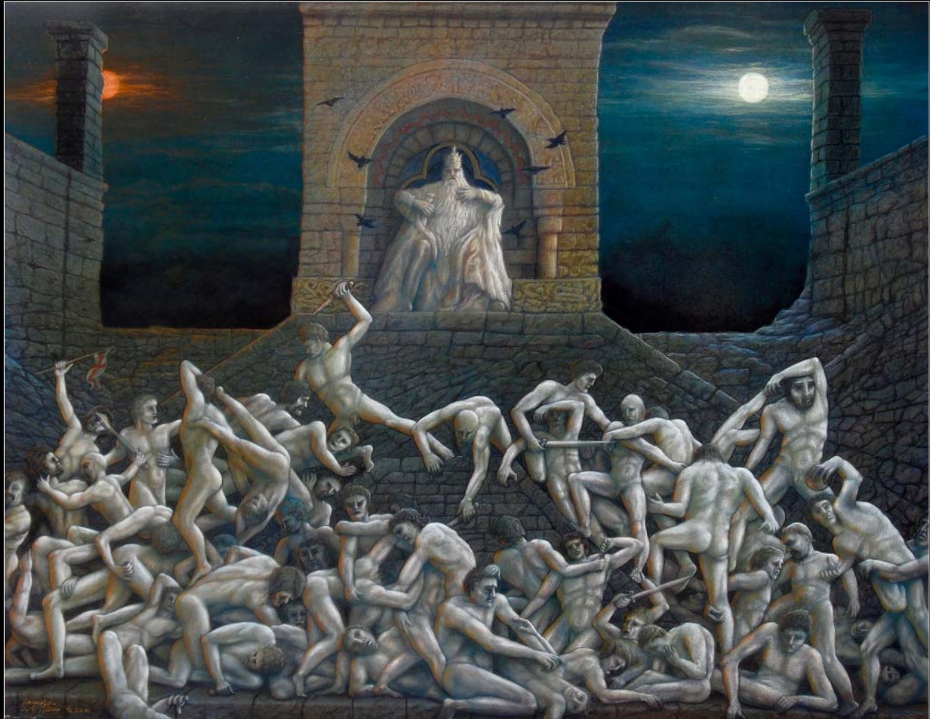
25. Nagle, w środku nocy... / Plötzlich, mitten in der Nacht... 2017, 98 × 120, €22 000,00