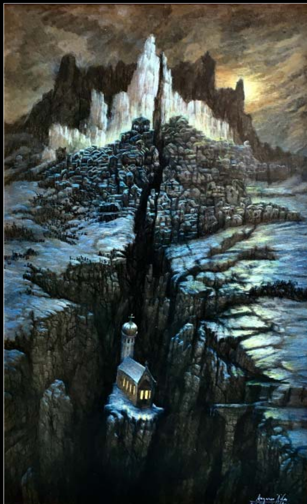
20. Chrześcijański zachód / Christliches Abendland 2020, 100 × 70, € 12 000,00