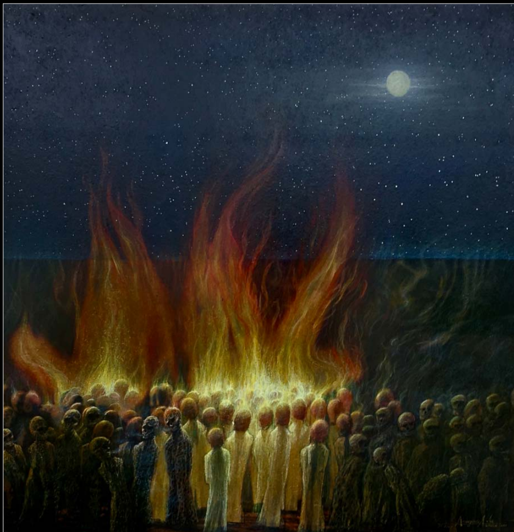
16. Procesja ofiarna / Opfergang 2020, 91 × 90, €9 000,00