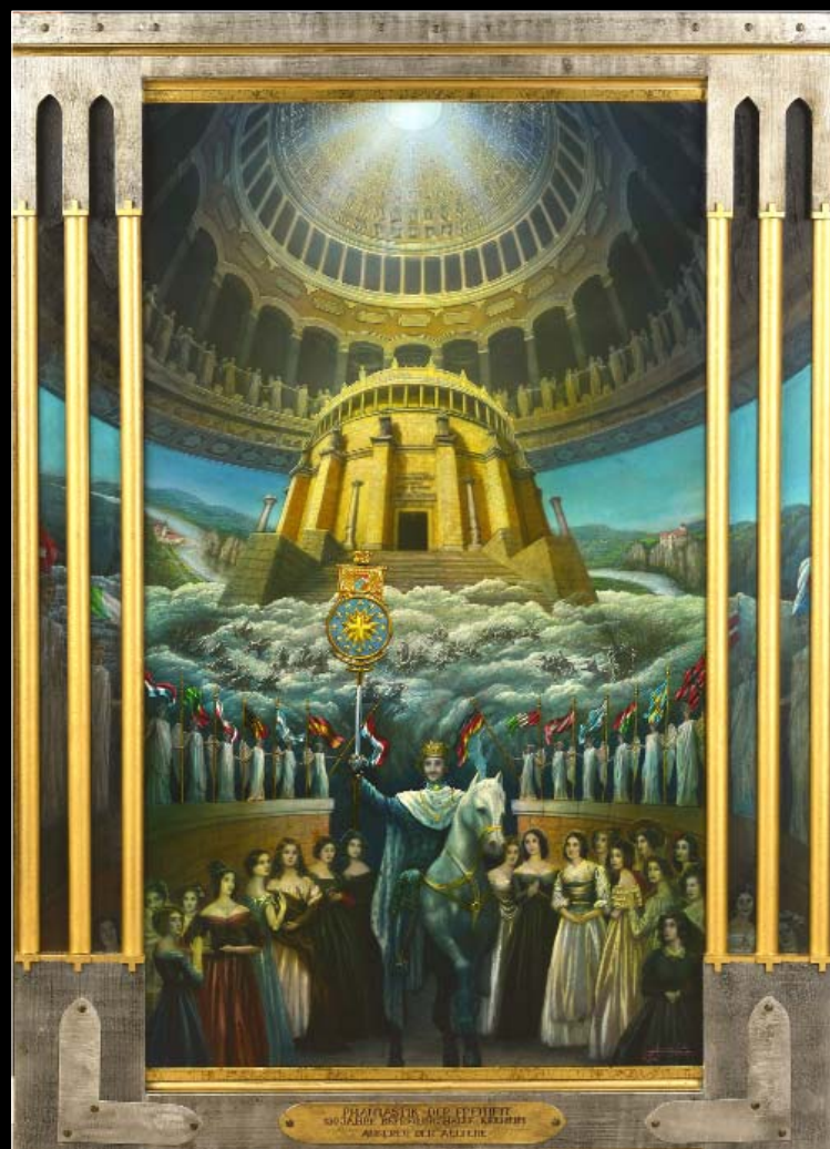
30. Fantastyka wolności (Hala Wyzwolenia) / Phantastik der Freiheit (Befreiungshalle Kelheim) 2013, 140 × 108, € 25 000,00