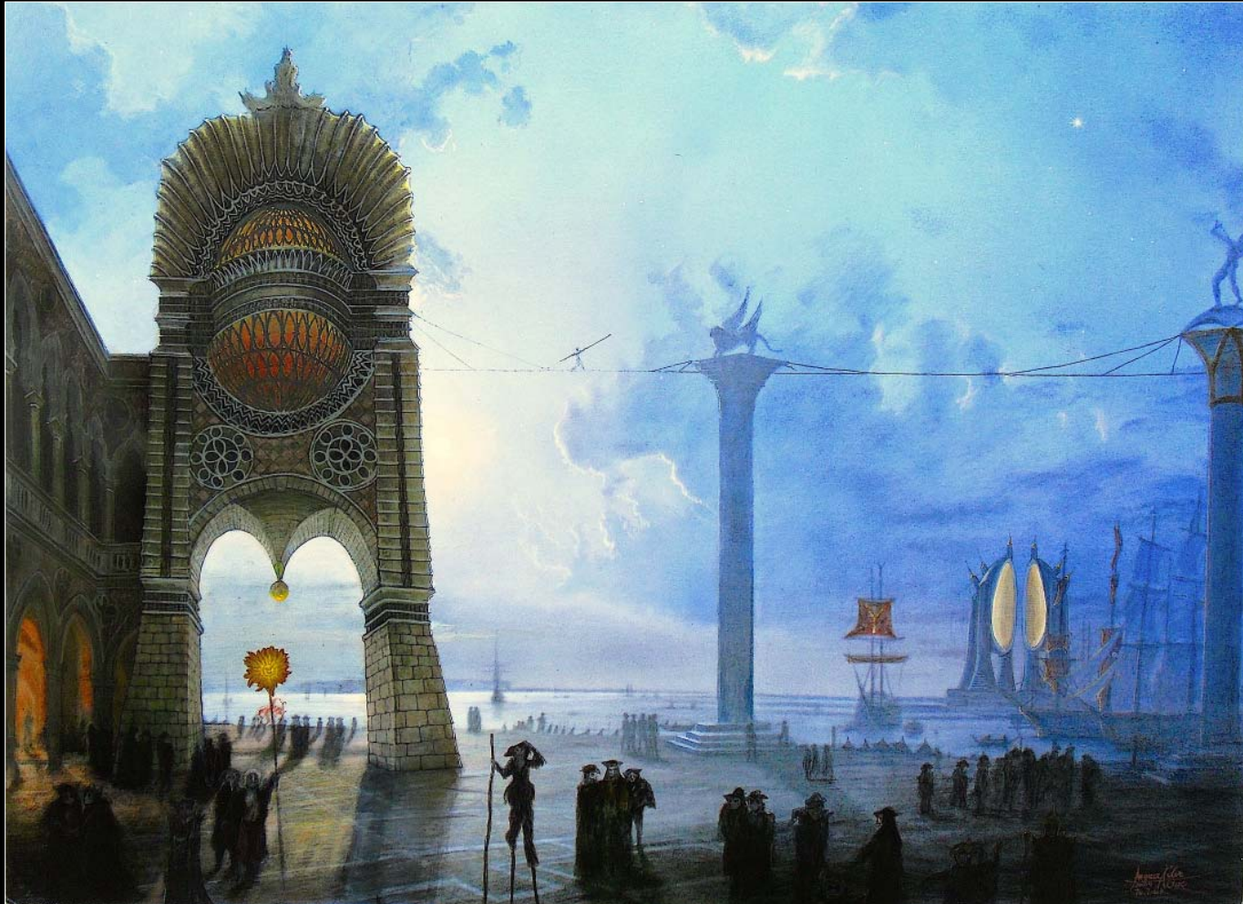
3. Karnawał w Wenecji (z architekturą autorstwa Angerera Starszego) / Karneval in Venedig (mit Architektur von Angerer der Ältere) 2015, 93 × 120, € 15 000,00