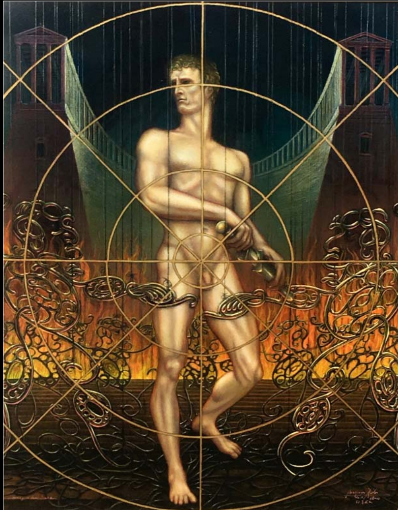
22. Na celowniku teatru marionetek / Im Fadenkreuz des Marionettentheaters 2019, 104 × 86, € 14 000,00