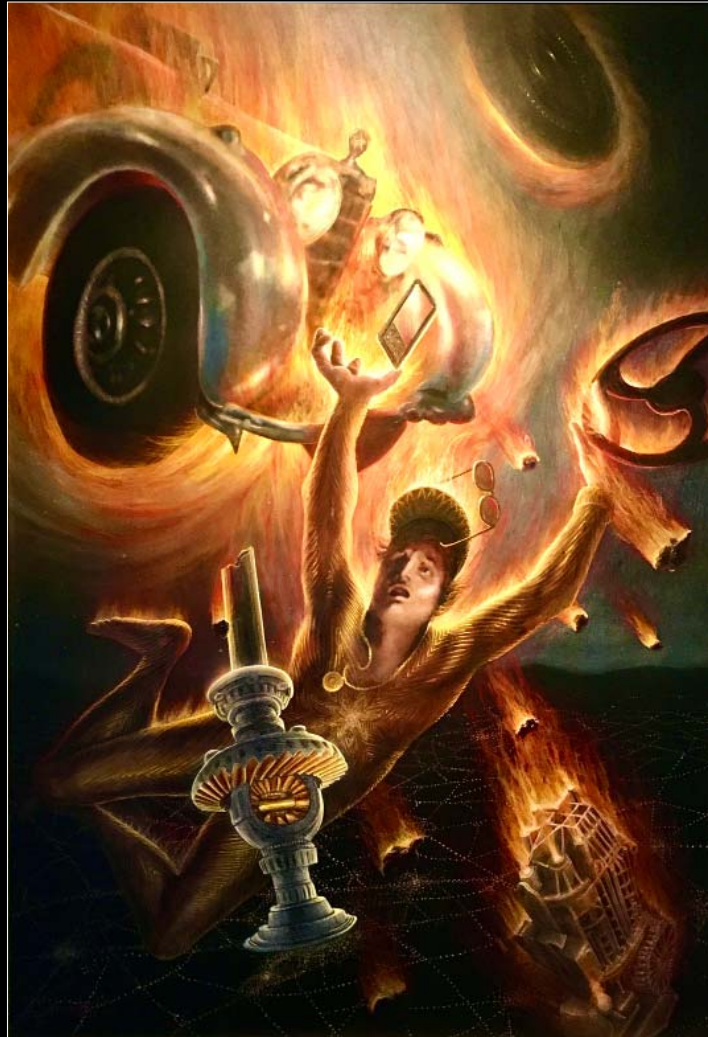
21. Upadek Faetona / Sturz des Phaeton 2021, 122 × 92, € 15 000,00