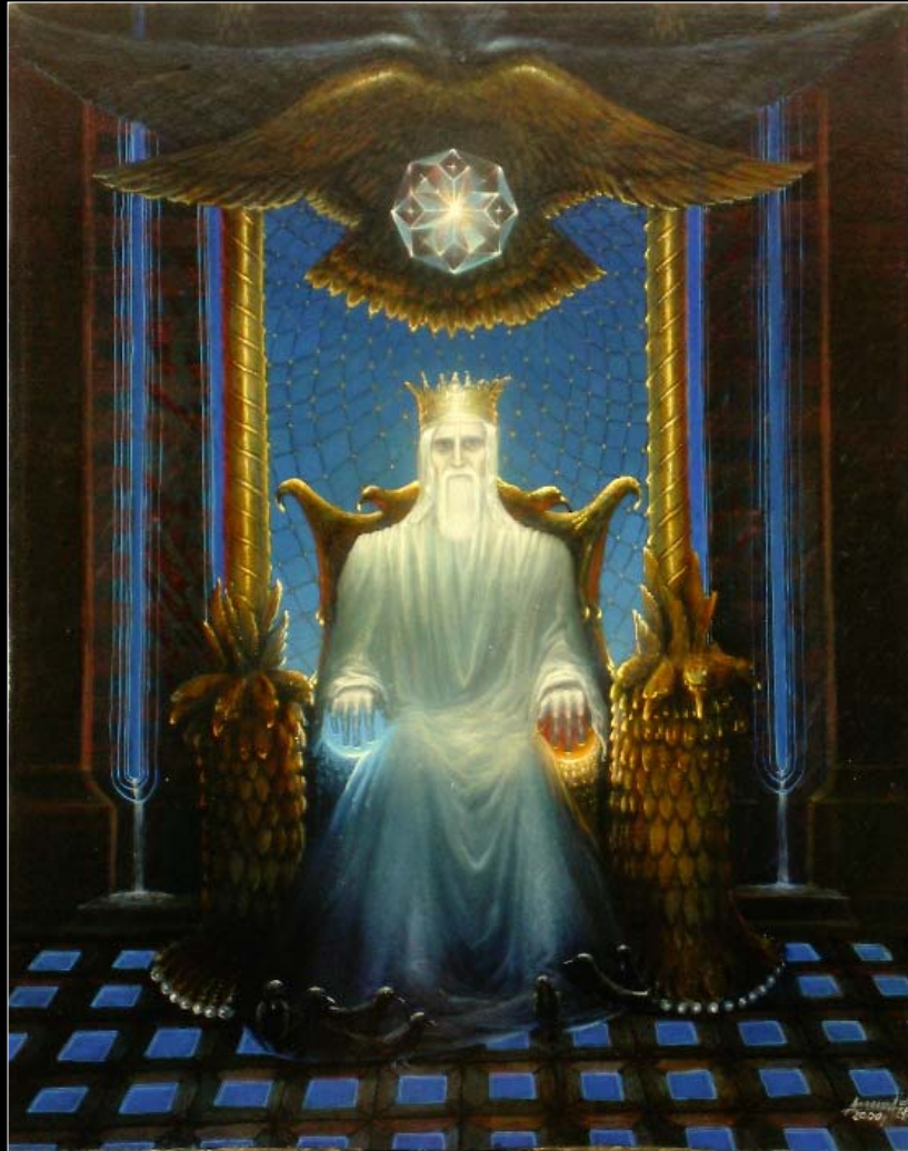
4. Stary cesarz na swoim tronie / Der Alte Kaiser auf seinem Thron 2000, 70 × 60, €9 000,00