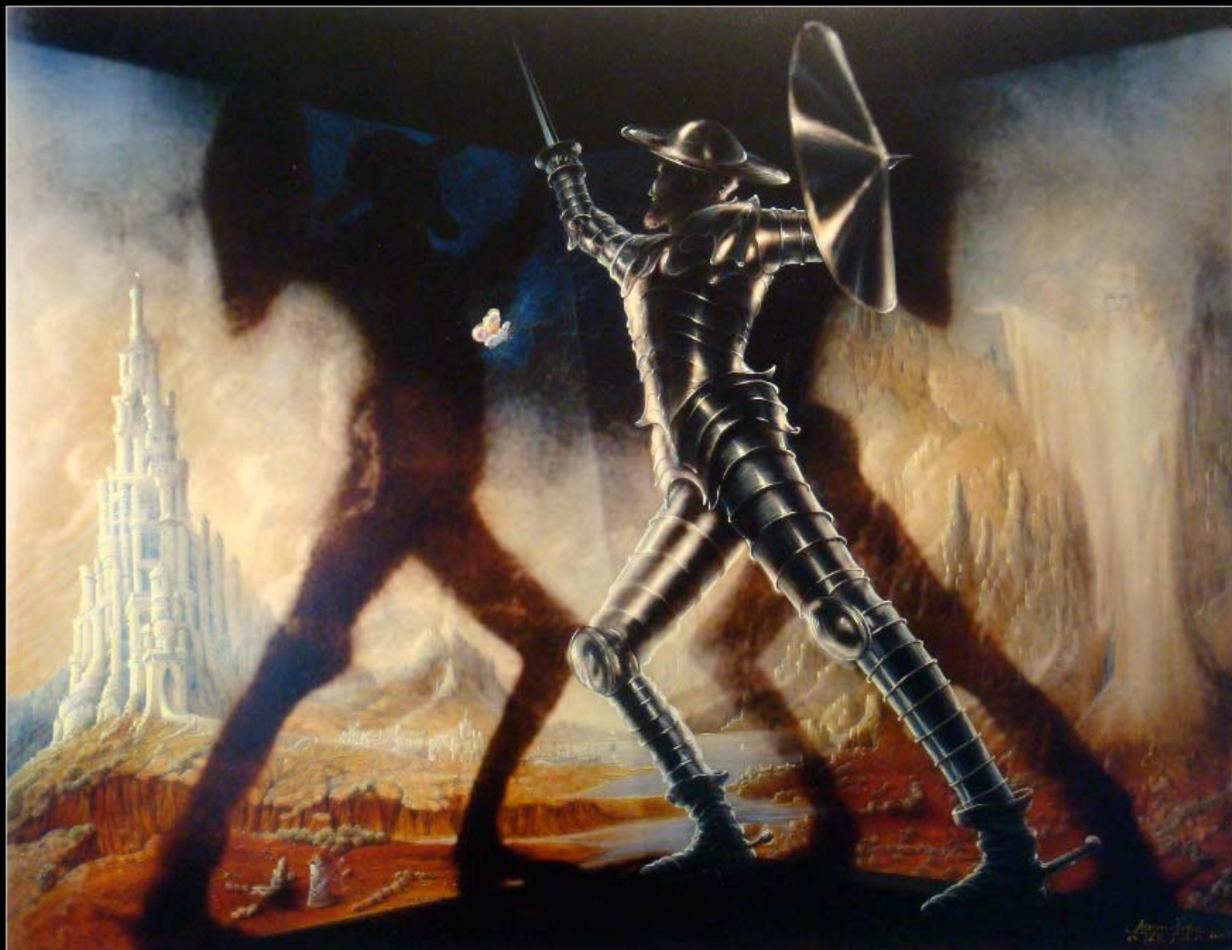
2. Don Kichot (brązowy medal Société des Artistes Français, Grand Palais Paris) / Don Quijote (Bronze Medaille Société des Artistes Français, Grand Palais Paris) 2009, 90 × 110, € 15 000,00