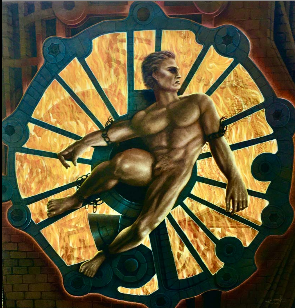
6. Prometeusz w niewoli / Der gefesselte Prometheus 2019, 110 × 110, € 13 000,00