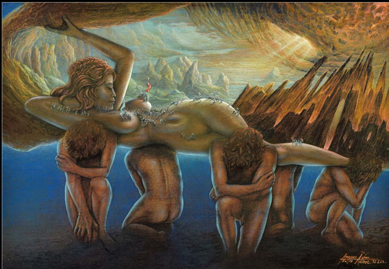
11. Gaja (Erda) / Gaia (Erda) 2017, 64 × 84, €9 000,00