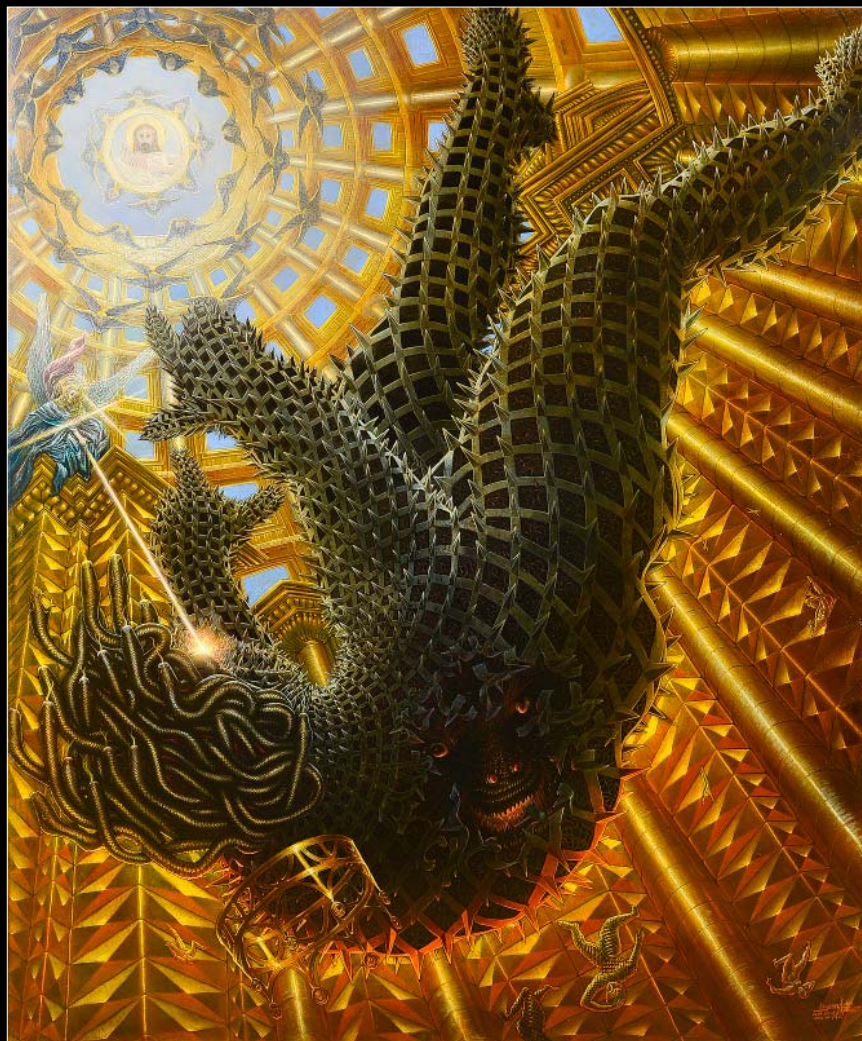
27. Piekło absolutne (srebrny medal Société des Artistes Français w Grand Palais Paris) / Absoluter Höllensturz (Silbermedaille Société des Artistes Français im Grand Palais Paris) 2008, 135 × 116, € 25 000,00