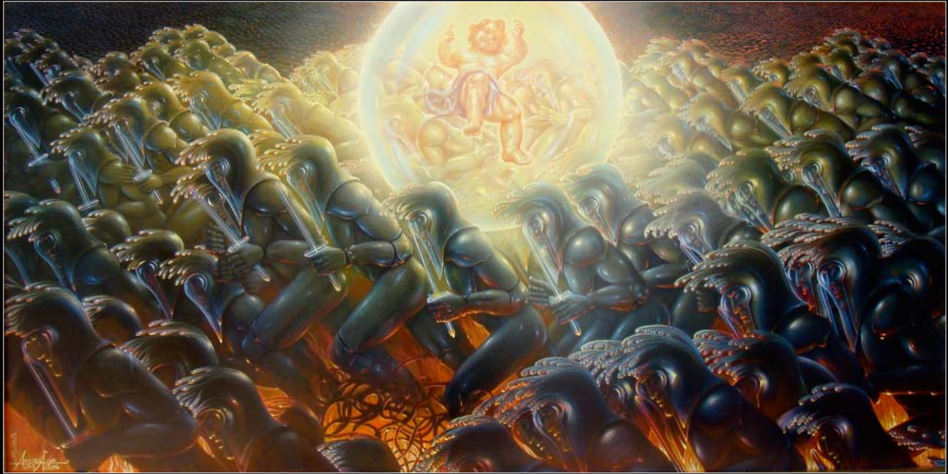
1. Światłość świata I / Das Licht der Welt I 2009, 72 × 132, € 15 000,00