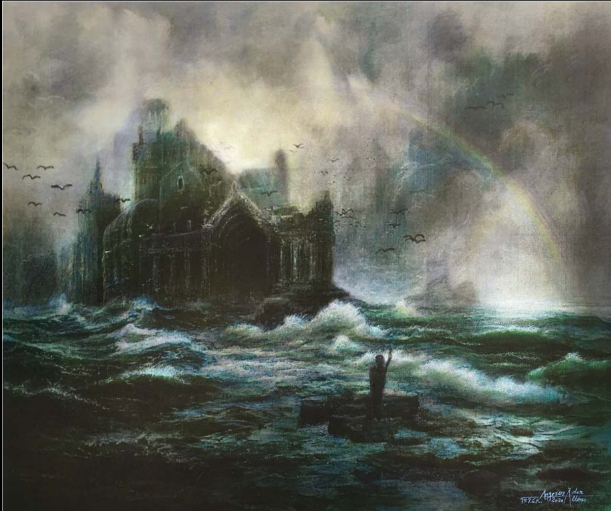
14. Na przegranej pozycji / Auf verlorenem Posten 2020, 80 × 90, € 10 000,00