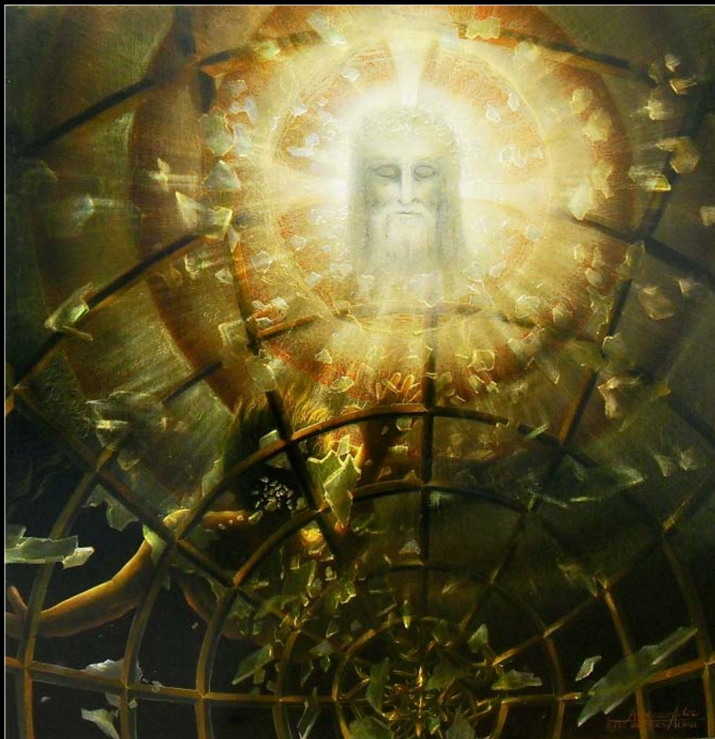
26. Światło świata II / Das Licht der Welt II 2013, 80 × 80, € 10000,00