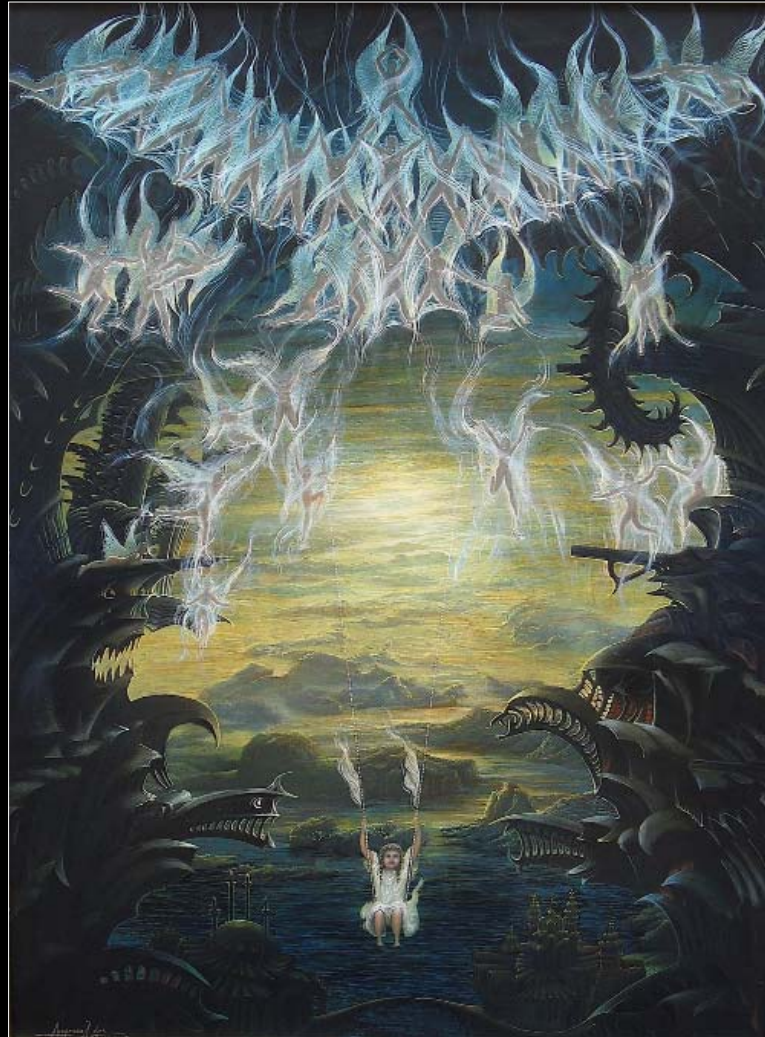
8. Magia niewinności / Zauber der Unschuld 2009, 100 × 80, € 12 000,00