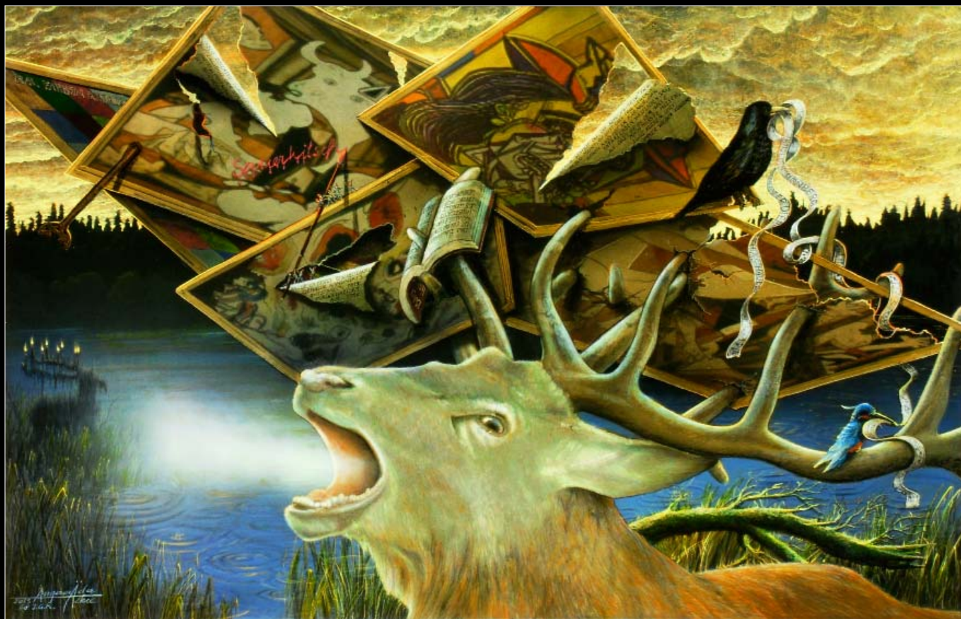
15. Zemsta ryczącego jelenia / Die Rache des röhrenden Hirsches 2013, 74 × 103, € 14 000,00