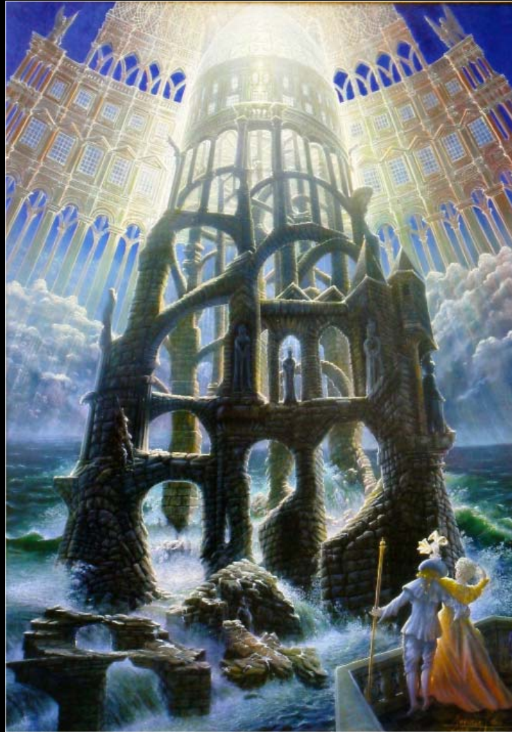
10. Dzieci Olimpu / Kinder des Olymp 2008, 88 × 68, € 12 000,00