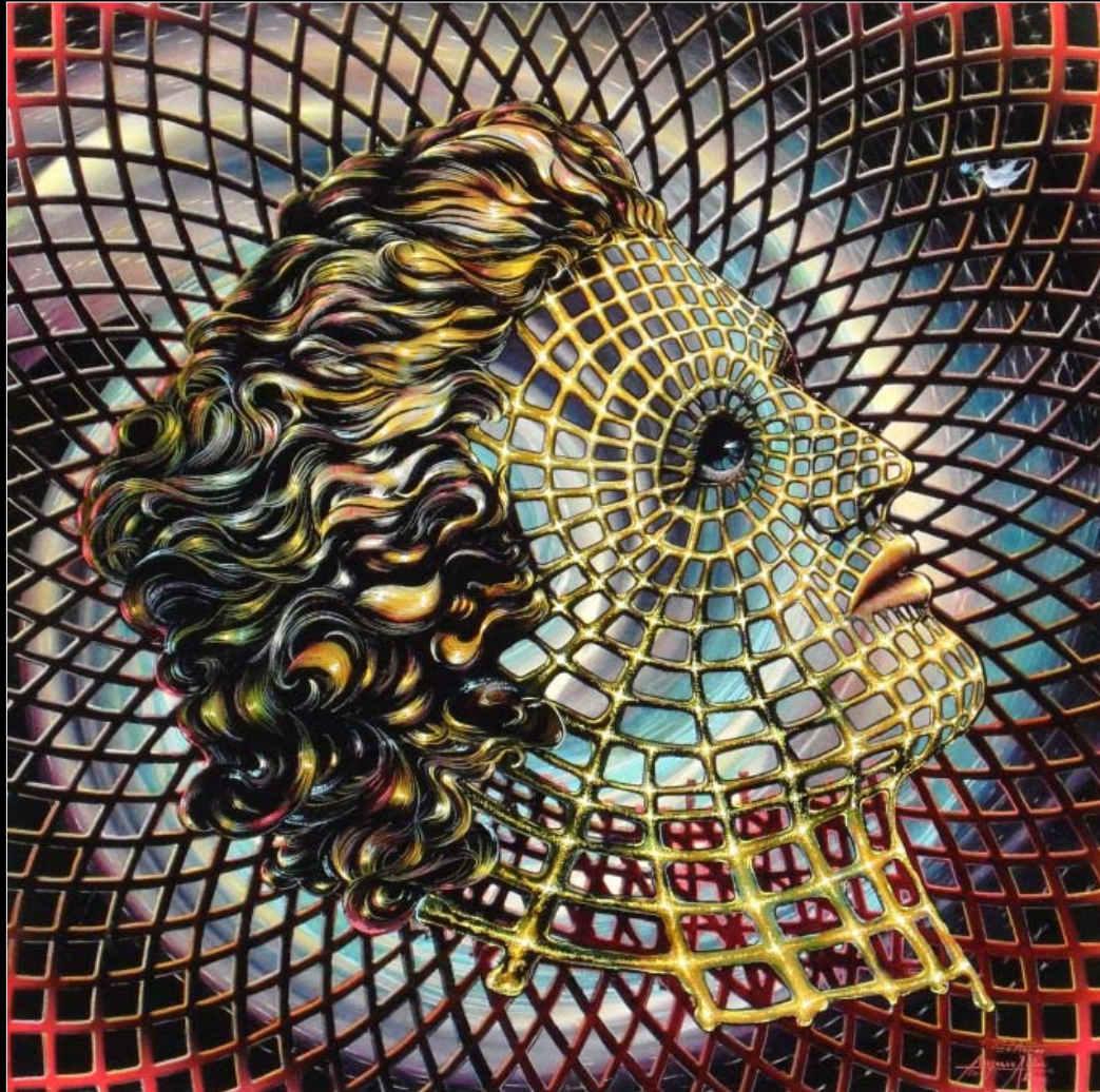
19. Połączony świat / Vernetzte Welt 2002, 77 × 77, €8 000,00