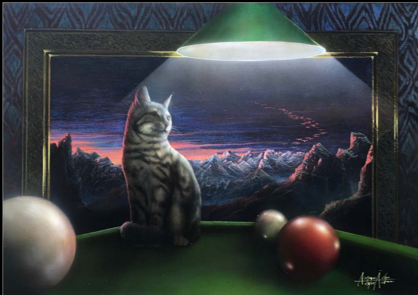
28. Kot na stole bilardowym / Katze auf dem Billard 2005, 70 × 90, € 10 000,00