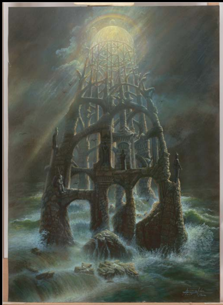
12. Siedziba starych bogów / Sitz der Alten Götter 2005, 90 × 70, €8 000,00