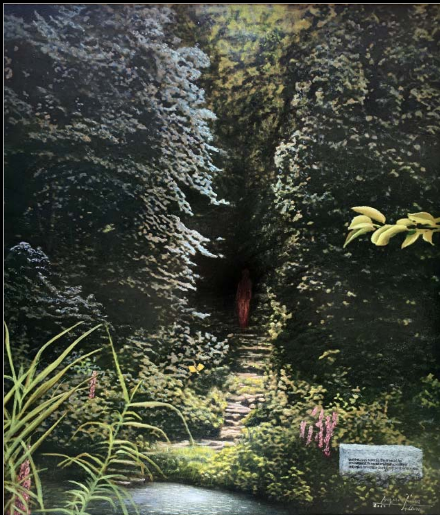
5. Ciemność lasu (według Roberta Frosta) / Des Waldes Dunkel (nach Robert Frost) 2021, 75 × 69, €8 000,00