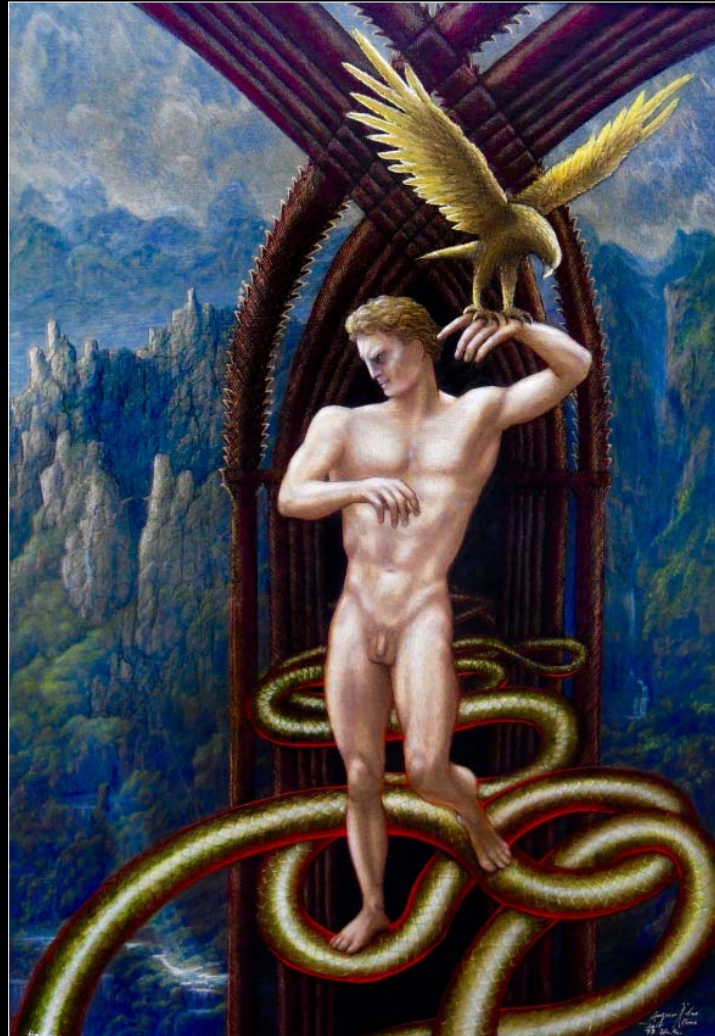
23. To jest Pan Ziemi (według Novalisa) / Das ist der Herr der Erde (nach Novalis) 2019, 105 × 81, € 12 000,00