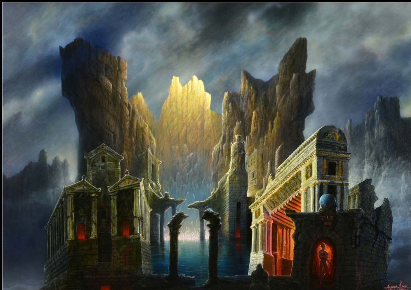
7. Wnętrze góry / Das Innere des Berges 2009, 90 × 120, € 18 000,00