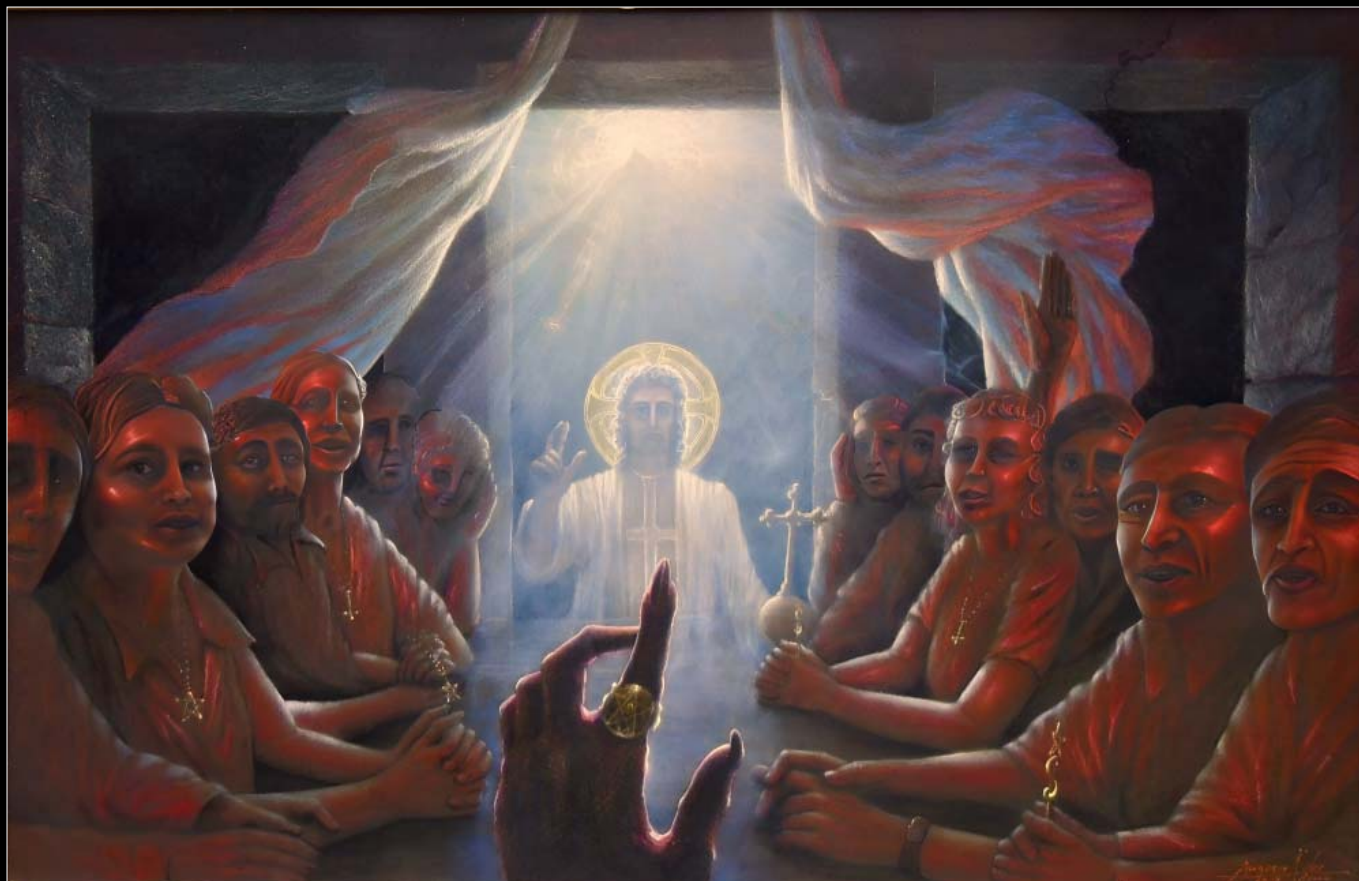
18. Przybycie Antychrysta / Ankunft des Antichristen 2013, 75 × 103, € 10 000,00