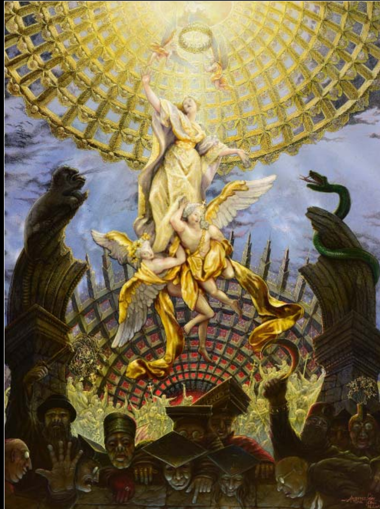
24. Wniebowzięcie Maryi / Maria Himmelfahrt 2016, 120 × 98, €22 000,00