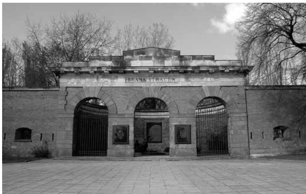
6. Brama Straceń z wmurowanymi tablicami upamiętniającymi pomordowanych w Cytadeli Warszawskiej