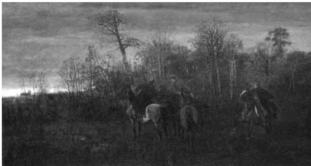
1. Ludomir Benedyktowicz, Podjazd powstańców