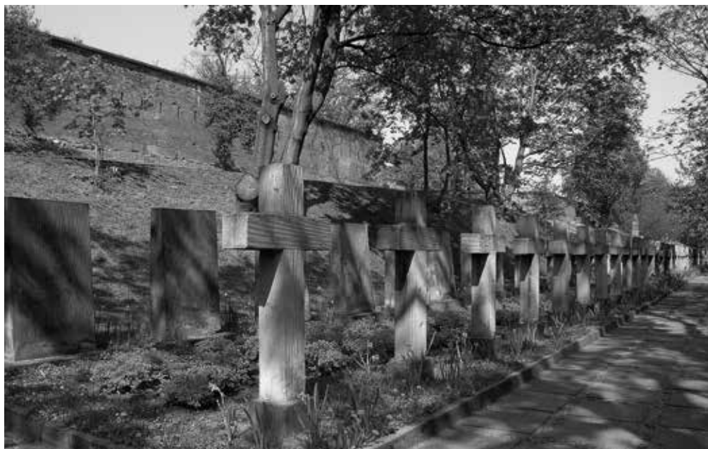
5. Symboliczny cmentarz straconych na stokach Cytadeli Warszawskiej nad Wisłą