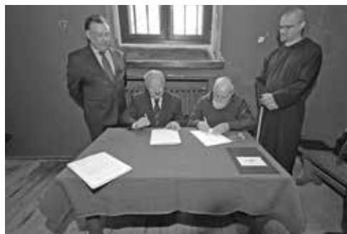
3. Podpisanie dokumentów darowizny portretu bł. o. Honorata Koźmińskiego