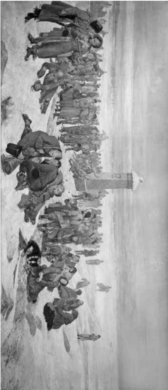
8. Aleksander Sochaczewski, Pożegnanie Europy