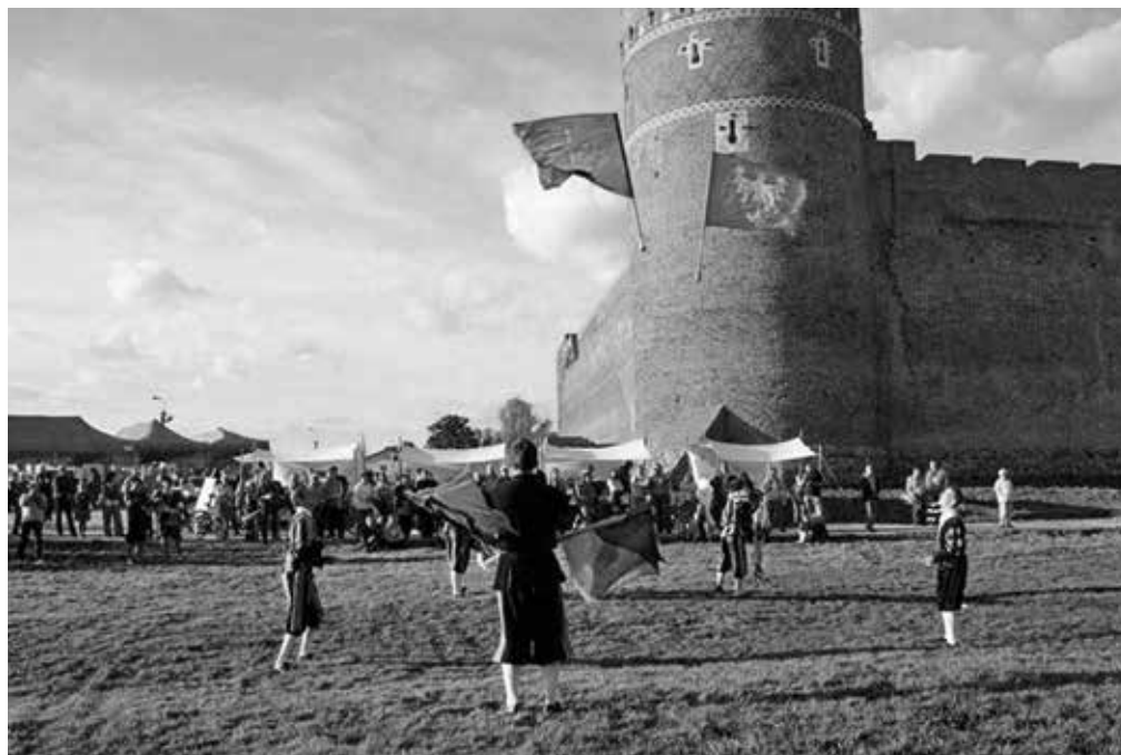
1. Spotkania z historią przed Zamkiem w Ciechanowie