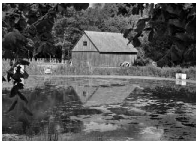
9. Młyn z Zajączkowa

Projekt pn.: „Zdarzyło się kiedyś nad wodą – Trasa turystyczna w radomskim skansenie” pozwolił wzbogacić radomski skansen o kolejne obiekty: dwa nowe oraz osiem zabytkowych. Został wybudowany nowy amfiteatr z zapleczem wystawienniczo-konferencyjnym oraz pracownia konserwacji zabytków z zapleczem. W amfiteatrze z zadaszoną sceną i widownią na 322 miejsc siedzących, odbywać się będą imprezy kulturalno-turystyczne. W budynku mieścić się będą m.in. sala wystawienniczo-konferencyjna oraz garderoby dla artystów. Drugi nowy obiekt – pracownia konserwacji stanowić będzie zaplecze techniczne dla konserwowanych i translokowanych zabytków. W budynku umiejscowiono pracownię stolarską, pracownię konserwatorską, magazyn zbiorów, garaże, warsztaty oraz inne pomieszczenia pomocnicze i socjalne. Obiekt wyposażony został w windę towarową do obsługi magazynu zbiorów na poddaszu. Na nowej trasie turystycznej podziwiać można osiem zabytkowych obiektów m.in. zagrodę okólnik z Solca składającą się z czterech budynków – dwóch stodół ze spichlerzami, oboro-stajni oraz zadaszonej bramy wjazdowej, a także chałupę z Solca. W skansenie znalazł się także trak z Molend, a także dwa młyny – z Zofiówki napędzany turbiną oraz Zajączkowa na koło wodne. Projekt w radomskim skansenie wpłynie