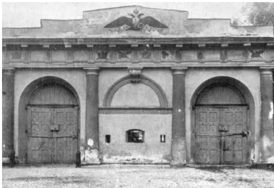
BRAMA STRACENÓW (IWANOWSKA).