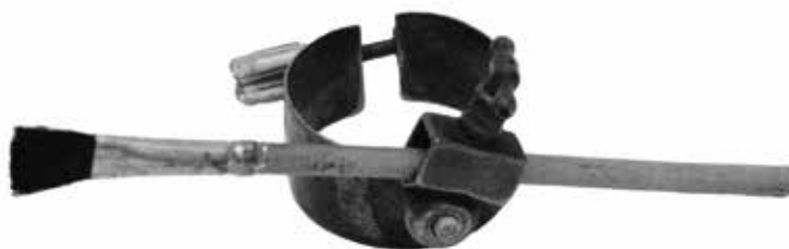
2. Proteza Ludomira Benedyktowicza