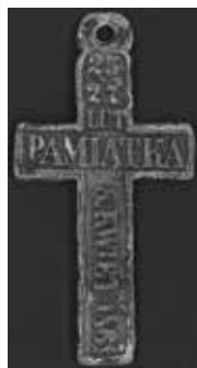
5. Krzyż upamiętniający manifestację patriotyczną 1861