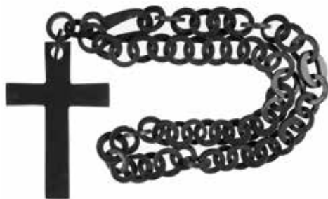
4. Krzyż z okresu żałoby narodowej