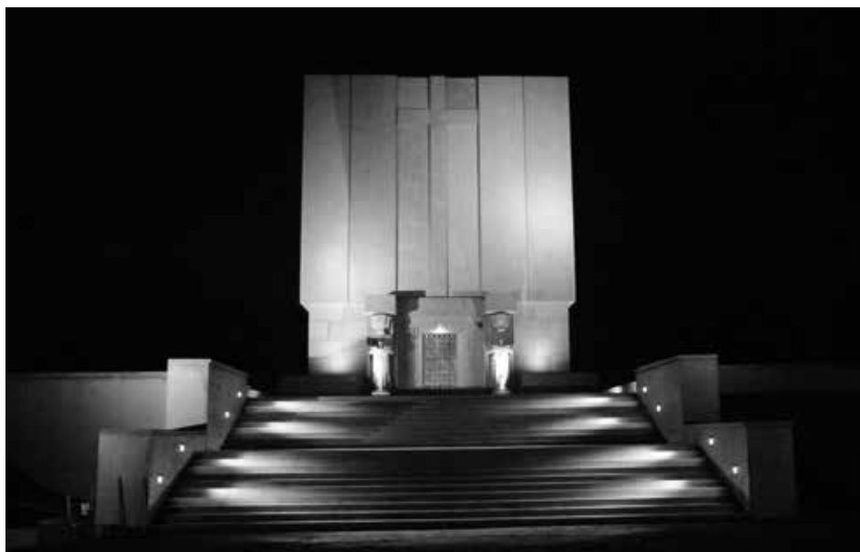
5. Pomnik Mauzoleum nocą

Realizacja projektu pn.: „Ponarwie. Konserwacja i rewitalizacja fortu ziemnego i pomnika-mauzoleum poległych w bitwie pod Ostrołęką 26 maja 1831 roku” uchroniła fort ziemny i pomnik-mauzoleum przed dalszą dewastacją. Dzięki wsparciu z Unii Europejskiej możliwe było przeprowadzenie prac konserwatorskich, w wyniku których pomnik-mauzoleum został zaadaptowany na potrzeby Muzeum Powstania Listopadowego. Pomnik Mauzoleum stanowi jeden z nielicznych zachowanych przykładów kubaturowych budynków z okresu dwudziestolecia międzywojennego upamiętniających poległych w bitwach 1831 roku. Zwiedzający mogą podziwiać przygotowane ekspozycje, m.in.: „Panorama bitwy pod Ostrołęką 26 maja 1831 roku i dzieje kampanii 1831 roku. Wirtualizacja przestrzeni historycznej pola bitwy”, „Obchody setnej rocznicy bitwy pod Ostrołęką w kontekście obchodów ogólnokrajowych upamiętniających wybuch powstania listopadowego i bitwy kampanii 1831 roku”. W ramach projektu uporządkowano także zieleni na terenie fortu, oczyszczono fosę oraz zrekonstruowano profile i nasypy wału ziemnego z bocznymi tarasami pomnika.