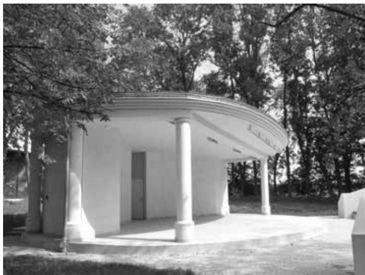
6. Wybudowany amfiteatr Muzeum im. Jacka Malczewskiego w Radomiu