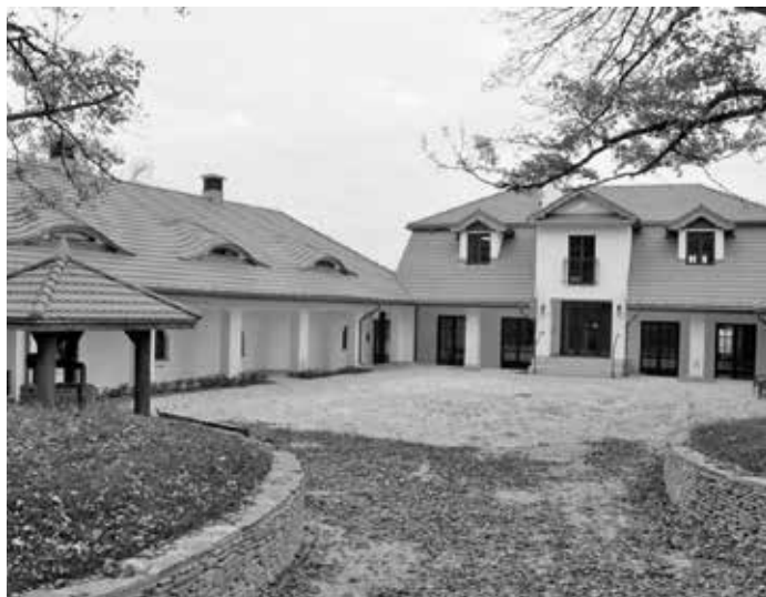
7. Widok na Folwark