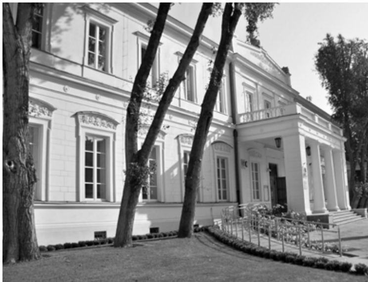
4. Budynek Mazowieckiego Centrum Kultury i Sztuki po renowacji

Mazowieckie Centrum Kultury i Sztuki (MCKiS) dzięki środkom z Unii stało się miejscem dostępnym również dla osób niepełnosprawnych. Na ten cel w ramach projektu pn.: „Zwiększenie dostępności do kultury poprzez renowację i modernizację zabytkowego budynku Mazowieckiego Centrum Kultury i Sztuki – stworzenie Centrum Aktywności Kulturalnej Osób Niepełnosprawnych” z UE przekazanych zostało ponad 1,5 mln zł. Jednym z udogodnień, które powstało w ramach projektu jest zewnętrzna winda. Poza tym po wyeliminowaniu architektonicznych barier na piętrze budynku – m.in. Galerii ELEKTOR, został stworzony program promocji twórczości osób niepełnosprawnych. W ramach tego programu instytucja będzie przynajmniej raz na kwartał organizowała imprezę artystyczną poświęconą twórczości osób niepełnosprawnych z obszaru Mazowsza. Została również wykonana renowacja zabytkowej elewacji i rekultywacja zieleni wokół obiektu.