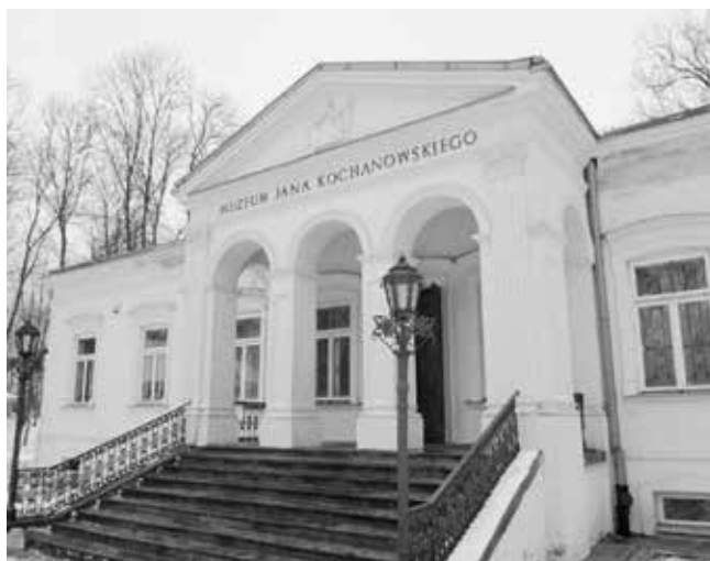
5. Muzeum Jana Kochanowskiego (oddział Muzeum im. Jacka Malczewskiego w Radomiu)

Celem projektu jest zwiększenie atrakcyjności turystycznej i nadanie większego znaczenia miejscu urodzenia Jana Kochanowskiego, a także innych terenów powiatu, cennych ze względu na walory naturalne i kulturowe. Projekt zakłada m.in. odbudowę istniejących stawów oraz utworzenie na terenie zespołu przyrodniczo-historycznego „Sycyna” terenowej ścieżki edukacji ekologicznej, wyposażenie jej w małą architekturę turystyczną oraz wyznaczenie wielofunkcyjnego szlaku turystycznego obejmującego tereny doliny Scynki i Doliny Zwolenki znajdujące się na obszarze Natura 2000.