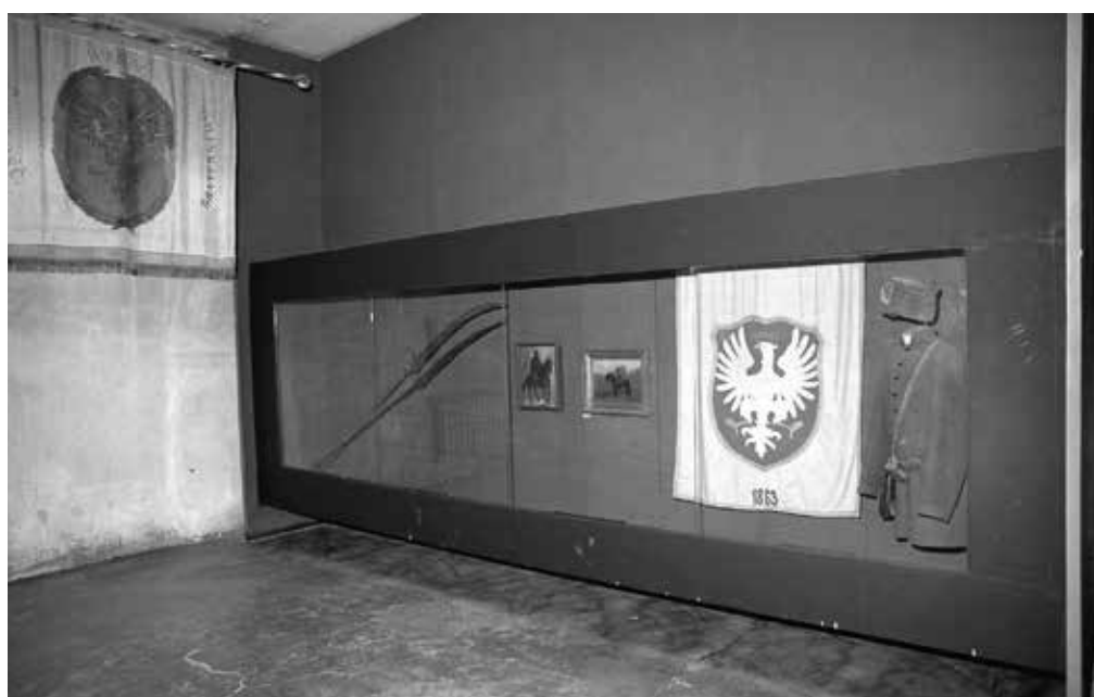
7. Muzeum X Pawilonu Cytadeli Warszawskiej Oddział Muzeum Niepodległości