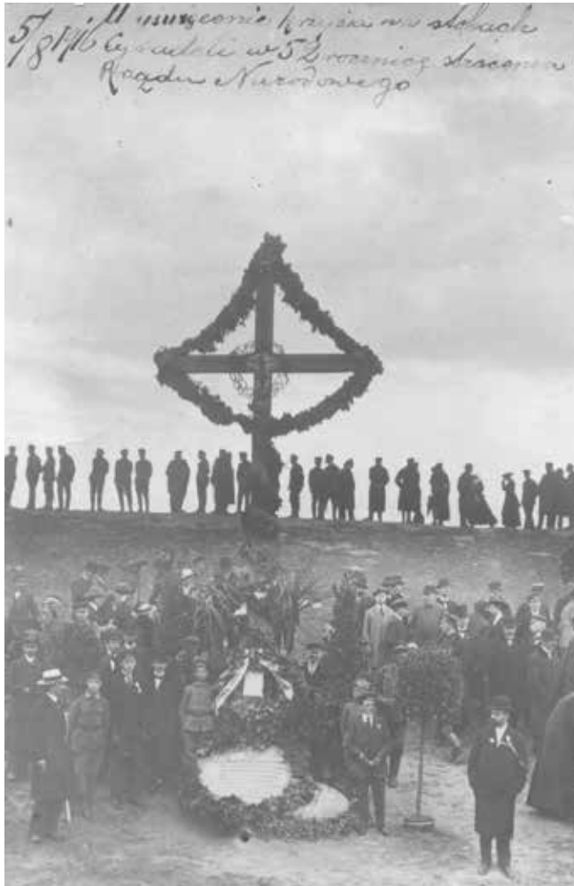
1. Krzyż w miejscu stracenia Romualda Traugutta

i Spółki pocztówkę z reprodukcją współczesnej grafiki Ostatnie słowo pociechy (Warszawska Cytadela 1863). Ukazuje ona wnętrze jednej z cel X Pawilonu 9 .