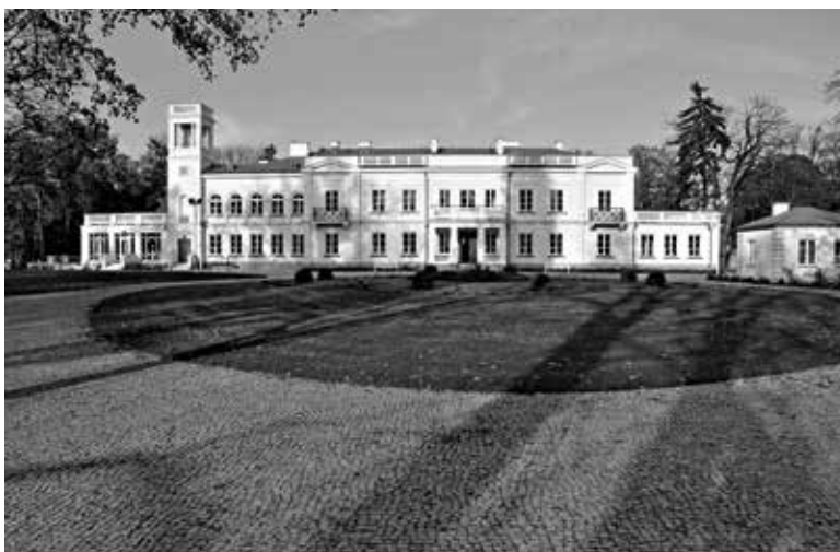
3. Zespół Pałacowo-Parkowy im. Fryderyka Chopina w Sannikach

Europejskie Centrum Artystyczne może poszczycić się zabytkowym Zespołem Pałacowo-Parkowym w Sannikach, w którym przebywał Fryderyk Chopin. Obiekt ten wymagał kapitalnego remontu, co udało się zrealizować w ramach projektu „Rewaloryzacja Zespołu Pałacowo-Parkowego im. Fryderyka Chopina” dofinansowanego ze środków UE kwotą prawie 17 mln zł. Prace remontowe obejmowały m.in. rozebranie istniejących stropów i posadzek oraz wykonanie nowych, wzmocnienie murów, wymianę stolarki okiennej i drzwiowej, stropu wieży widokowej oraz instalacji wewnętrznych. Priorytetowym zamysłem projektu było zmodernizowanie i wyposażenie pałacowych sal, a w nowo zaaranżowanych pomieszczeniach stworzenie miejsc, które będą pełnić funkcje koncertowo-muzyczne, wystawiennicze, edukacyjne i turystyczne. W ramach aranżacji parku zostały wykonane nowe nasadzenia, powstały nowe ścieżki