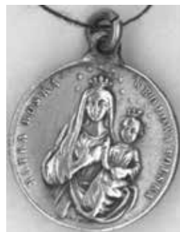
6. Medalik pamiątkowy

nane przez więźniów i zesłańców syberyjskich. Wśród zgromadzonych 97 obiektów spotykamy pamiątkowe krzyżyki, broszki, bransoletki, łańcuchy, medaliki, medaliony, naszyjniki i wisioriki, pierścionki oraz szpilki pamiątkowe.