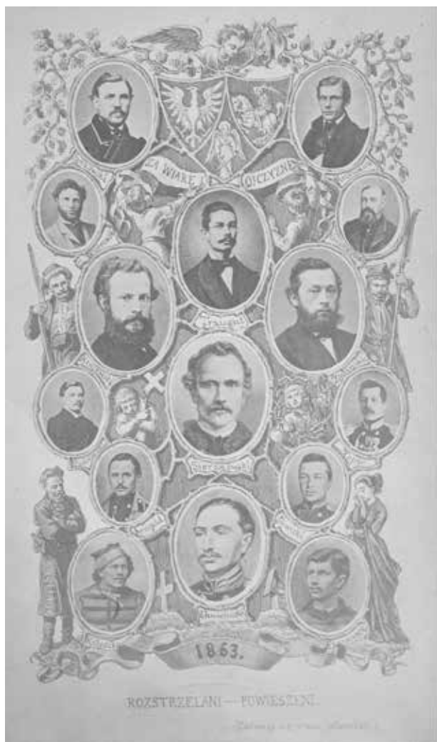
3. Tableau z napisem „Za wiarę i ojczyznę”