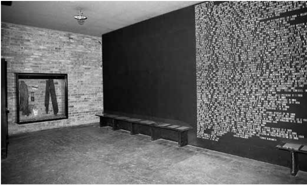
3. Tablica straconych na stokach Cytadeli Warszawskiej umieszczona w tzw. „korytarzu śmierci”