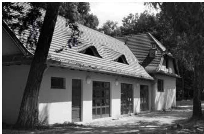
11. Karczma staropolska