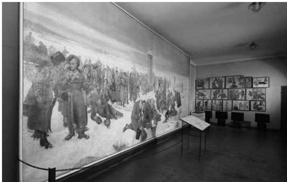
10. Fragment ekspozycji w Muzeum X Pawilonu; galeria malarstwa Aleksandra Sochaczewskiego

Muzeum X Pawilonu Cytadeli Warszawskiej zainaugurowało swoją działalność w stulecie wybuchu powstania styczniowego 22 stycznia 1963 r. We wschodnim skrzydle budynku otwarto wówczas pierwszą ekspozycję poświęconą powstaniu styczniowemu i I Proletariatowi. Otwarciu nadano bardzo uroczysty, wręcz propagandowy charakter z udziałem najwyższych władz państwowych i partyjnych. Jednocześnie trwały prace rekonstrukcyjne w pozostałej części budynku, przywracające mu jego dawny, więzienny wygląd. Po ich zakończeniu, 18 września 1969 r. otworzono tu ekspozycję stałą 79 .