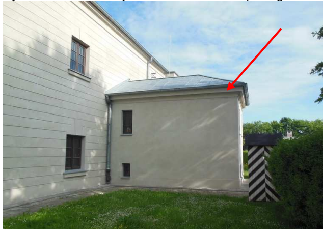
Fot. 1. Widok na przybudówkę zlokalizowaną od wschodu przy skrzydle wschodnim budynku X Pawilonu Cytadeli Warszawskiej oddziału Muzeum Niepodległości.