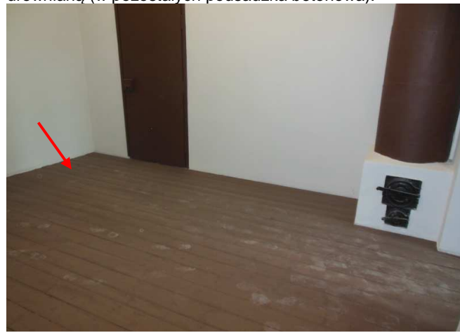
Fot. 22. Widok na jedno z czterech pomieszczeń na piętrze w skrzydle zachodnim X Pawilonu, posiadające podłogę drewnianą (w pozostałych podszadzka betonowa).