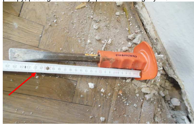
Fot. 3. Widok na pomiar przecinaka, którym pomierzono grubość warstw na płycie ceglanej stropu w postaci polepy, podłogi drewnianej i parkietu w magazynku.