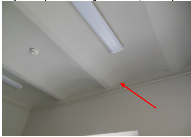
Fot. 13. Widok na płytę stropu Kleina nad parterem w pomieszczeniach za klatką schodową centralną budynku skrzydła zachodniego w kierunku południowym.