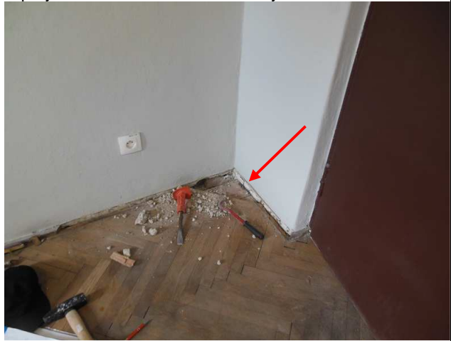
Fot. 5. Widok na miejsce wykonanej odkrywki w stropie od strony magazynku na piętrze zlokalizowanym w przybudówce od wschodu w skrzydle wschodnim.