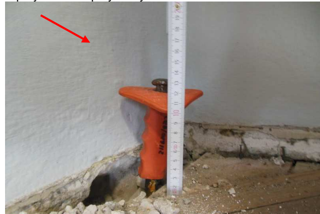
Fot. 2. Widok na pomierzoną grubość warstw znajdujących się na płycie ceglanej stropu Kleina nad parterem w pomieszczeniu magazynku zlokalizowanego w przybudówce przy skrzydle wschodnim od wschodu.