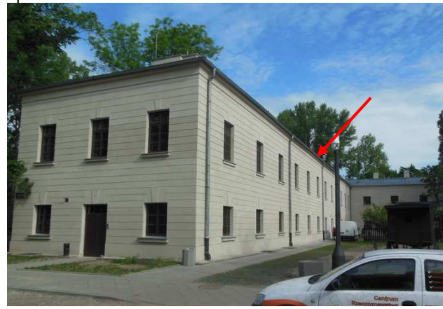
Fot. 11. Widok na skrzydło zachodnie budynku X Pawilonu Cytadeli Warszawskiej oddziału Muzeum Niepodległości, w którym znajdują się stropy nad parterem w pomieszczeniach będących w zakresie opracowania.