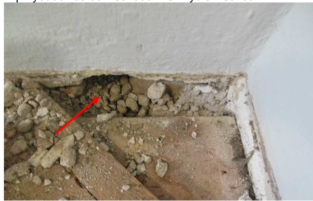
Fot. 4. Widok na miejsce wykonanej odkrywki w stropie od strony magazynku na piętrze zlokalizowanym w przybudówce od wschodu w skrzydle wschodnim.