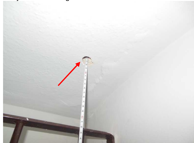
Fot. 17. Widok na miejsce wykonanego otworu przewiertu przez płytę stropu Kleina dla pomiaru grubości płyty w najcieńszym miejscu (28cm) zlokalizowanego nad parterem w pomieszczeniu za klatką schodową zlokalizowaną w środkowej części skrzydła zachodniego bud. X Pawilonu.