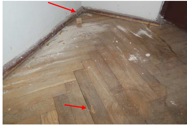
Fot. 10. Widok na podłogę w pomieszczeniu magazynku znajdującym się w przybudówce po stronie wschodniej skrzydła wschodniego oraz miejsca wykonanej odkrywki i otworu.