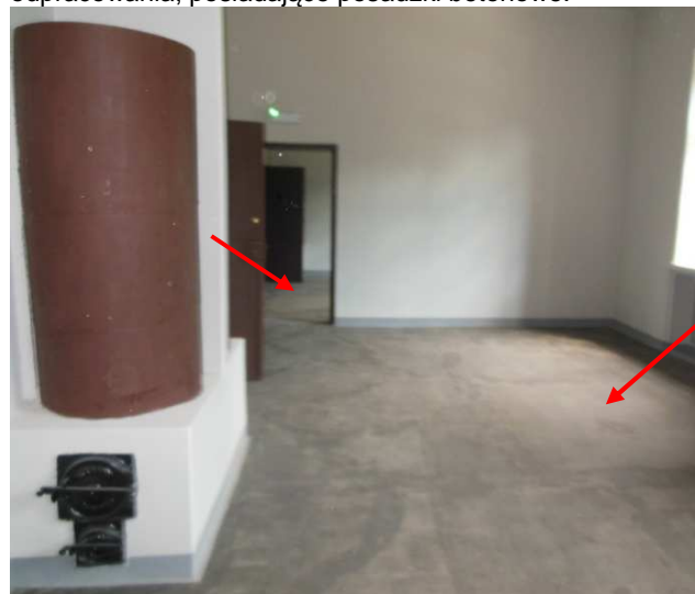
Fot. 23. Widok na pomieszczenia na piętrze w skrzydle zachodnim X Pawilonu będące przedmiotem odpracowania, posiadające posadzki betonowe.