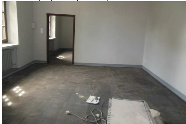
Fot. 19. Widok na pomieszczenie zlokalizowane na piętrze skrzydła zachodniego przylegającego do ściany oddzielającej go od klatki schodowej usytuowanej w środkowej części budynku skrzydła zach. X Pawilonu.