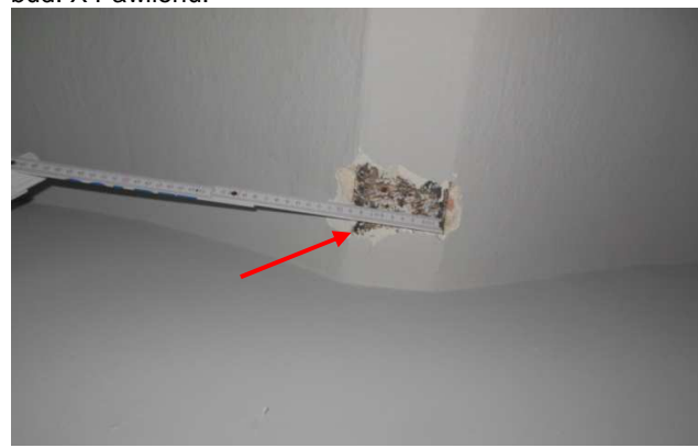
Fot. 15. Widok na pomierzoną szerokość belki stalowej stropu Kleina (92mm) zlokalizowanego nad parterem w części pomieszczeń za klatką schodową zlokalizowaną w środkowej części skrzydła zachodniego bud. X Pawilonu.