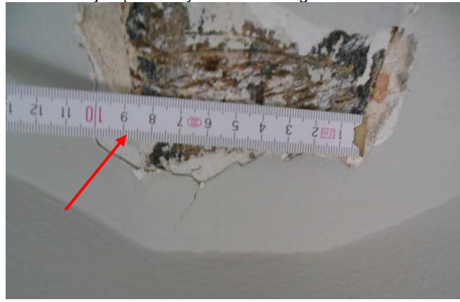
Fot. 14. Widok na pomierzoną szerokość belki stalowej stropu Kleina (92mm) zlokalizowanego nad parterem w części pomieszczeń za klatką schodową zlokalizowaną w środkowej części skrzydła zachodniego bud. X Pawilonu.