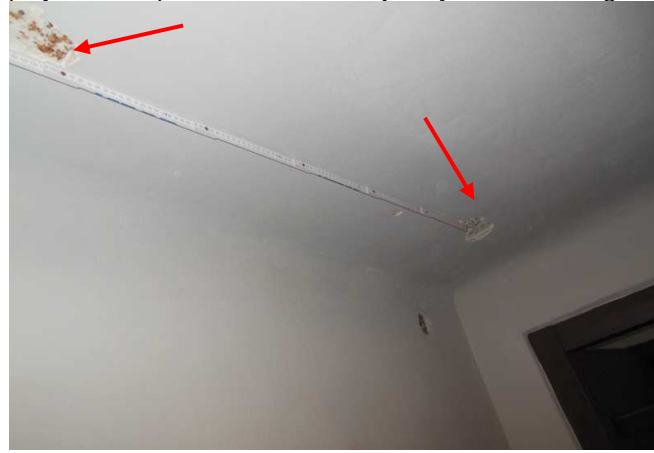
Fot. 8. Widok na rozstaw belek stalowych stropu Kleina nad parterem w magazynku zlokalizowanym w przybudówce po stronie wschodniej skrzydła wschodniego.