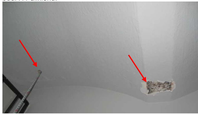
Fot. 16. Widok na miejsca wykonanego otworu przewiertu przez płytę stropu oraz pomierzoną szerokość belki stalowej stropu Kleina (92mm) zlokalizowanego nad parterem w części pomieszczeń za klatką schodową zlokalizowaną w środkowej części skrzydła zachodniego bud. X Pawilonu.