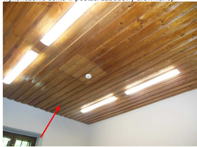
Fot. 21. Widok na jedno z czterech pomieszczeń na piętrze w skrzydle zachodnim X Pawilonu, posiadające wykończenie sufitu w postaci zabudowy drewnianej.