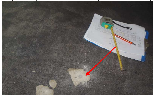
Fot. 20. Widok na miejsce wykonanego przewiertu przez płytę stropową nad parterem od strony pomieszczenia zlokalizowanego na piętrze skrzydła zachodniego przylegającego do klatki schodowej w środkowej części budynku skrzydła zach. X Pawilonu Cytadeli Warszawskiej.