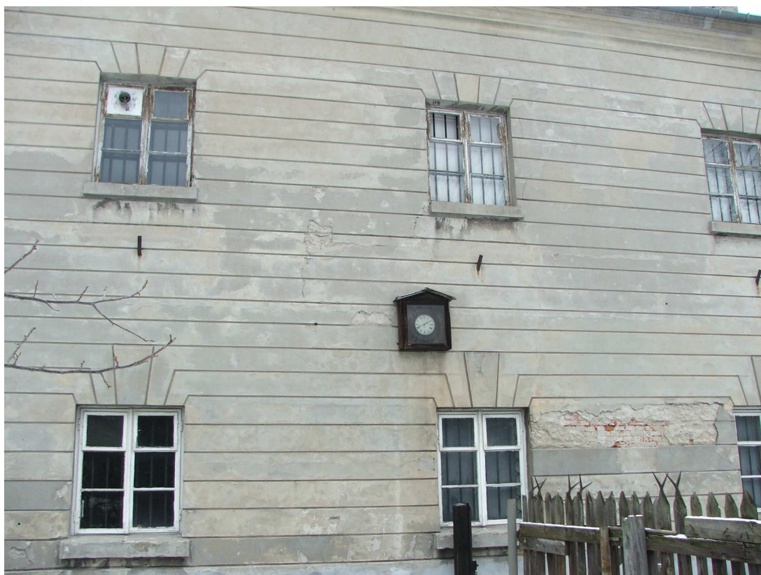
X Pawilon Cytadeli Warszawskiej, skrzydło północne, elewacja południowa, fragment.