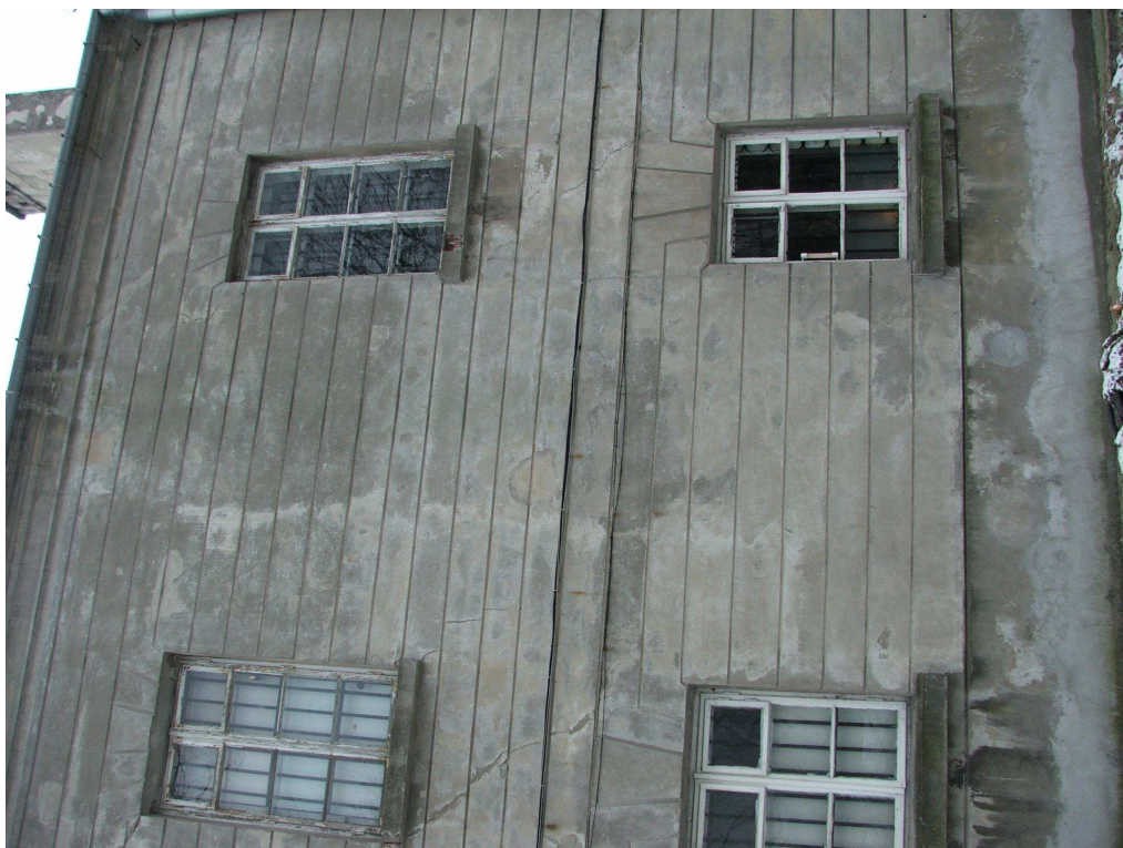
67 FOT. X Pawilon Cytadeli Warszawskiej, skrzydło północne, elewacja północna, fragment.